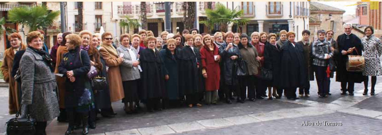
Alba de Tormes