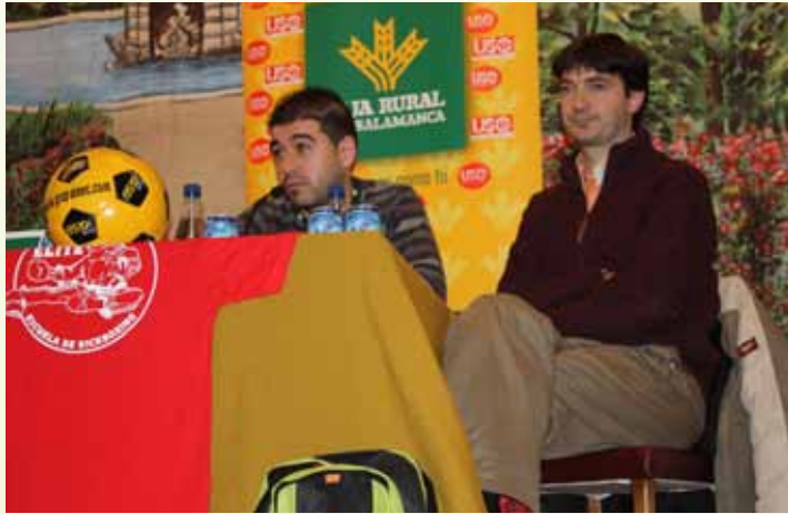
Los alumnos observaron mediante experiencias reales la forma más adecuada de cuidar sus hábitos alimenticios.

Unos doscientos alumnos del Colegio Santa Isabel de Alba de Tormes y del Instituto de Enseñanza Secundaria Leonardo da Vinci participaron en una mesa redonda con deportistas de elite. Un debate que sirvió a los alumnos para reflexionar acerca de la importancia de conseguir unos hábitos saludables en la alimentación diaria y su trascendencia en la vida deportiva.