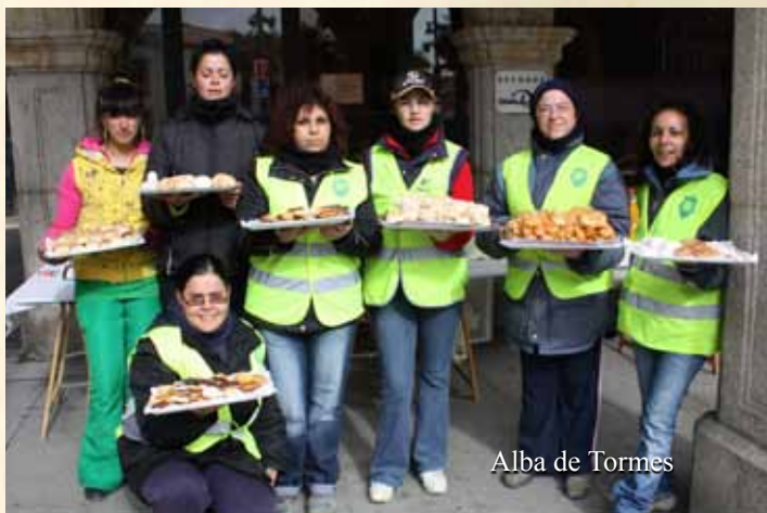
Alba de Tormes