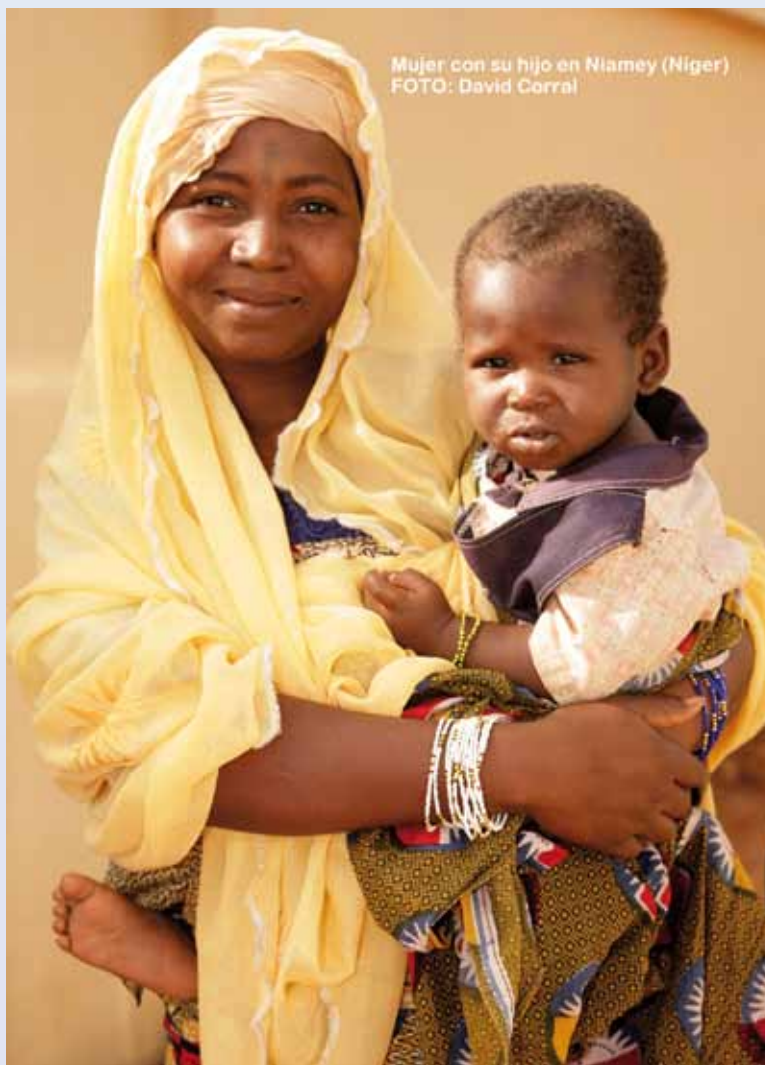
Mujer con su hijo en Niamey (Niger)