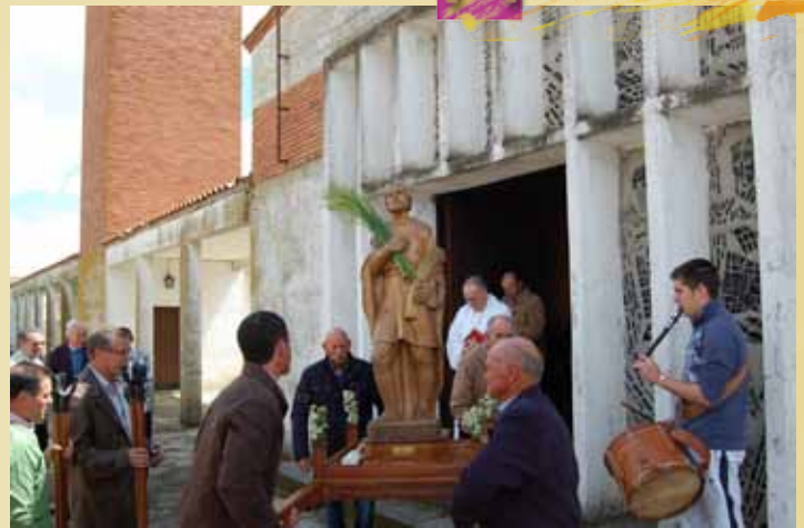
Torrejón de Alba