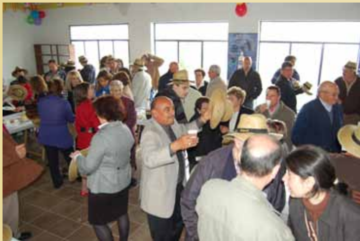
Torrejón de Alba