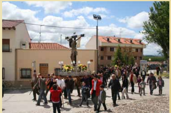
Alba de Tormes