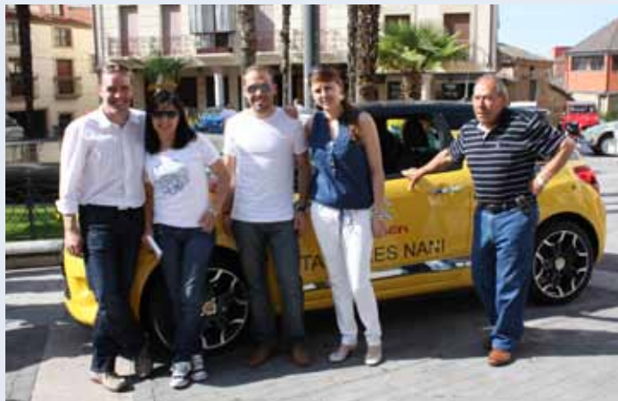
Zoppo de la villa ducal.

Quizás porque se convirtió en un hito para los hippies, asociada al mito juvenil, escaso de recursos, los participantes de la concentración se disfrazaron de hippies en una cena en el Camping Tormes y posterior fiesta en el Disco Bar