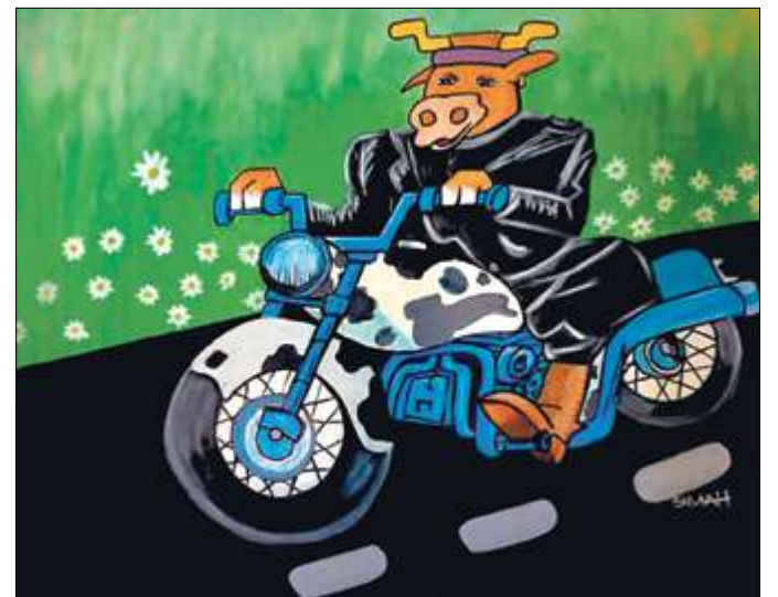
ENCUENTRA LAS 7 DIFERENCIAS