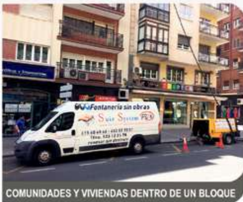
COMUNIDADES Y VIVIENDAS DENTRO DE UN BLOQUE