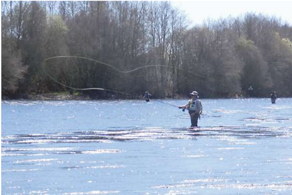
El Escenario Deportivo Social Tormes 1, buena alternativa a los cotos de pesca sin muerte | M. C.

En cuanto a la pesca en cotos trucheros, cada uno de estos escenarios tiene su propia reglamentación recogida en la Orden FYM/1574/2020, de 15 de diciembre, por la que se declaran los cotos