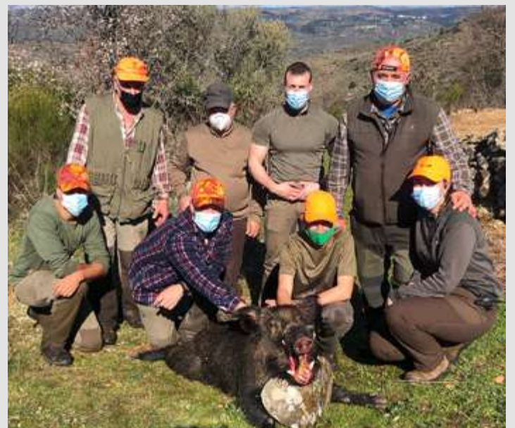
La escasez de caza menor ha supuesto mayor presión para el jabalí

nidos en las cacerías colectivas, monterías y ganchos han estado por debajo casi siempre de las previsiones. La autorización de un número mayor de cacerías en los cotos, así como la reducción de caza menor, ha supuesto una mayor presión venatoria para el jabalí, lo que se ha traducido en una reducción importante de ejemplares. Así que solo cabe esperar que se cumpla aquello de que: "No hay mal que por bien no venga".