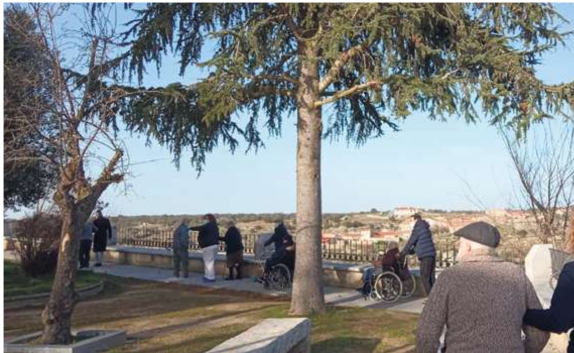
Los mayores de la residencia municipal durante la primera salida grupal por la villa

Afortunadamente, las medidas han resultado efectivas y Ledesma ha conseguido doblegar la curva y flexibilizar las restricciones. Esto ha permitido a los mayores poder salir de nuevo a pasear al aire libre fuera del centro, eso sí, sin olvidar las medidas, como llevar mascarilla, que siguen siendo esenciales aunque se haya administrado la vacuna.