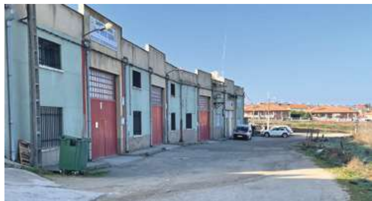
La reforma integral en el Camino de los Coladeros supondrá un desembolso de más de 100.000 euros

actuación que busca solucionar los graves problemas que llevan sufriendo los vecinos durante años como el de la pérdida de agua.