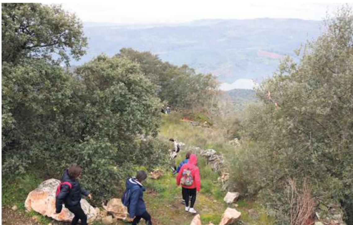
El merendero de La Barca permanece abierto y dispuesto para acoger a los senderistas en Vilvestre

A falta de que se celebre la Marcha Arribes del Duero organizada