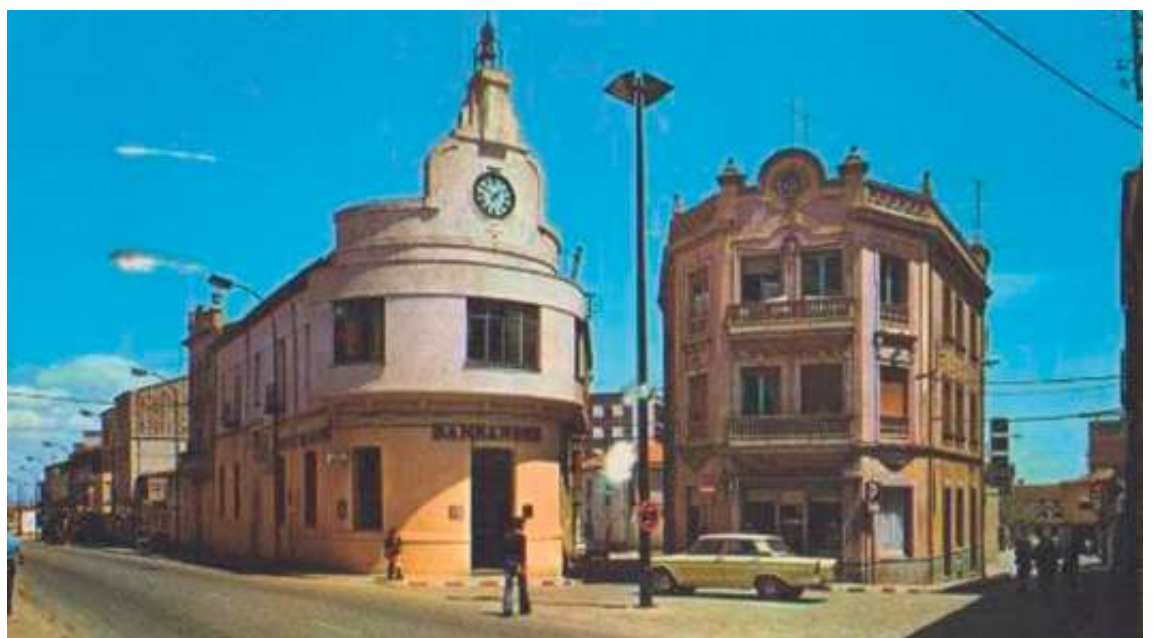
El Banco Santander ocupó la planta baja del edificio durante años, en la imagen en torno a los años 70