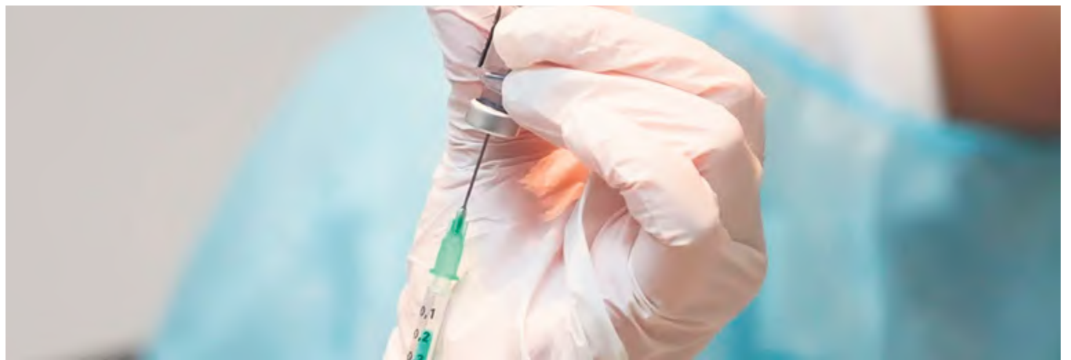
Imagen de una dosis de la vacuna frente a la Covid-19

Vacunar es la mejor herramienta de la que disponemos ahora mismo para empezar a ganar la batalla al coronavirus SARS-COV-2-, y hay que hacerlo