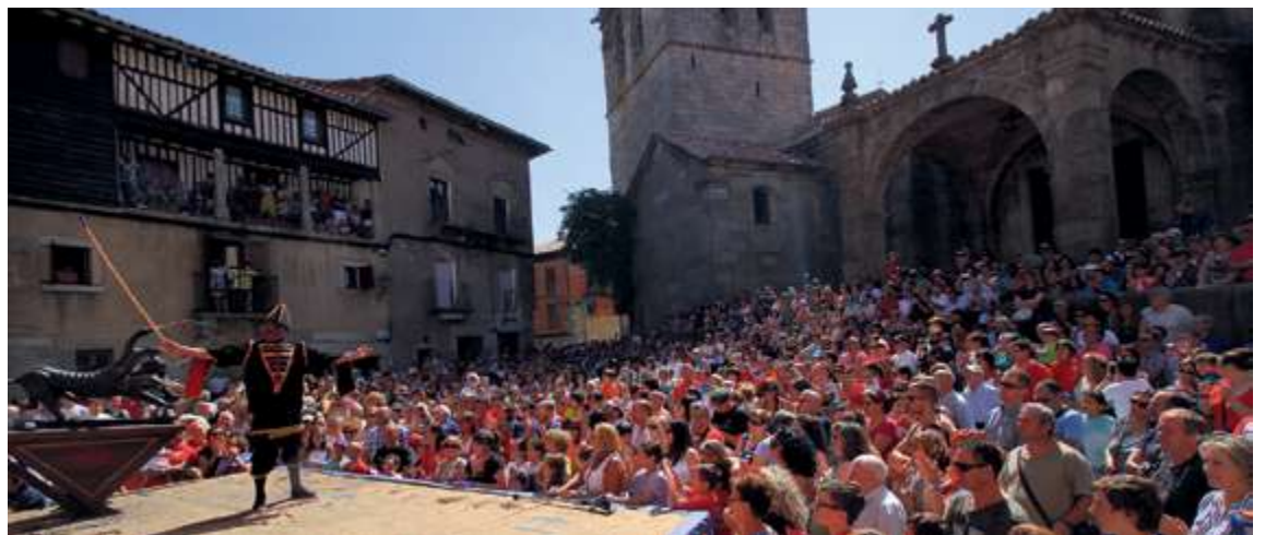
La representación de La Loa es una de las propuestas que más público atrae en La Alberca

todo tipo de tradiciones da mucha más visibilidad a todo esto.