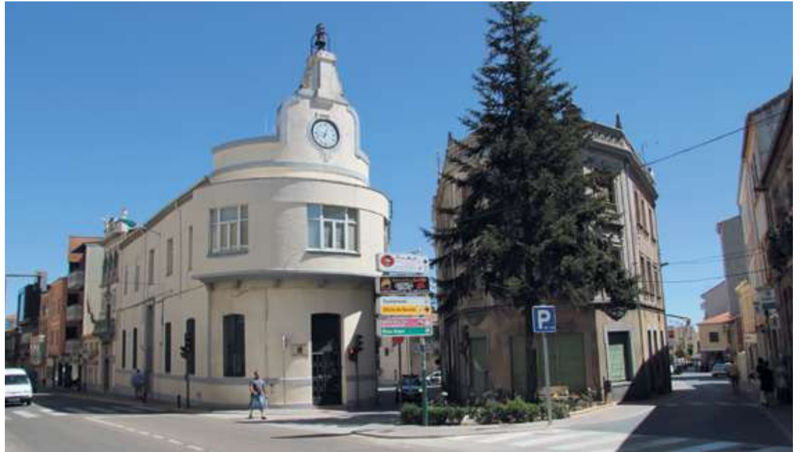
El edificio del reloj de Guijuelo en la época actual, con su actividad como Ayuntamiento ya finalizada

El destino del edificio, según los planes del Ayuntamiento, es el de recuperar su actividad original, destinándose a la cultura y recuperando el teatro, que fue de los primeros usos que perdió en una de sus muchas reformas.