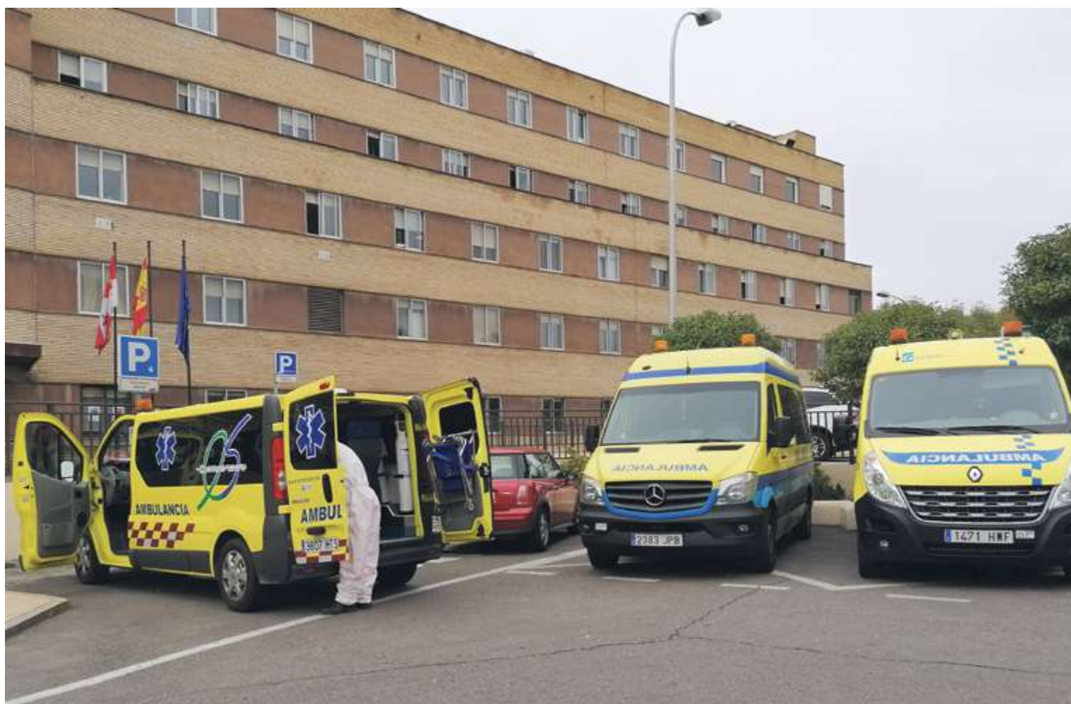
La pandemia de la Covid-19 ha puesto al límite a los hospitales durante los peores momentos de las tres olas

Ha sido un año muy duro, con más de 3 millones de contagios en nuestro país y cifras de mortalidad terribles -más de 65.000 personas con prueba diagnóstica han fallecido desde que el virus llegó a España-, con situaciones inéditas que nunca imaginamos que tendríamos que afrontar. En Salamanca cerca de 30.000 personas se han contagiado de Covid-19, y más de 1.500 personas han fallecido. Y aunque durante la primera ola las personas mayores fueron las más golpeadas por el coronavirus, un año después el virus ha demostrado que no entiende de edades y que ser joven no libra de sus efectos y de un posible agravamiento de la enfermedad.