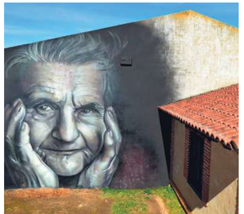
Mural en homenaje a la mujer rural

Ahora los visitantes, y aficionados al arte urbano, tienen un motivo más para acercarse hasta Vega de Tirados, el último mural en sumarse. El rostro, las manos y hasta las arrugas de la mujer mayor plasmada en esta obra son "reflejo de nuestra historia", tal y como señalan desde el Ayuntamiento.