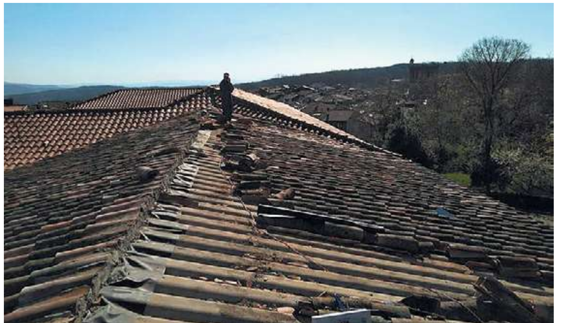
El comedor (arriba) y el tejado (abajo) son dos de las áreas que acaban de recibir mejoras en el centro | K.R.