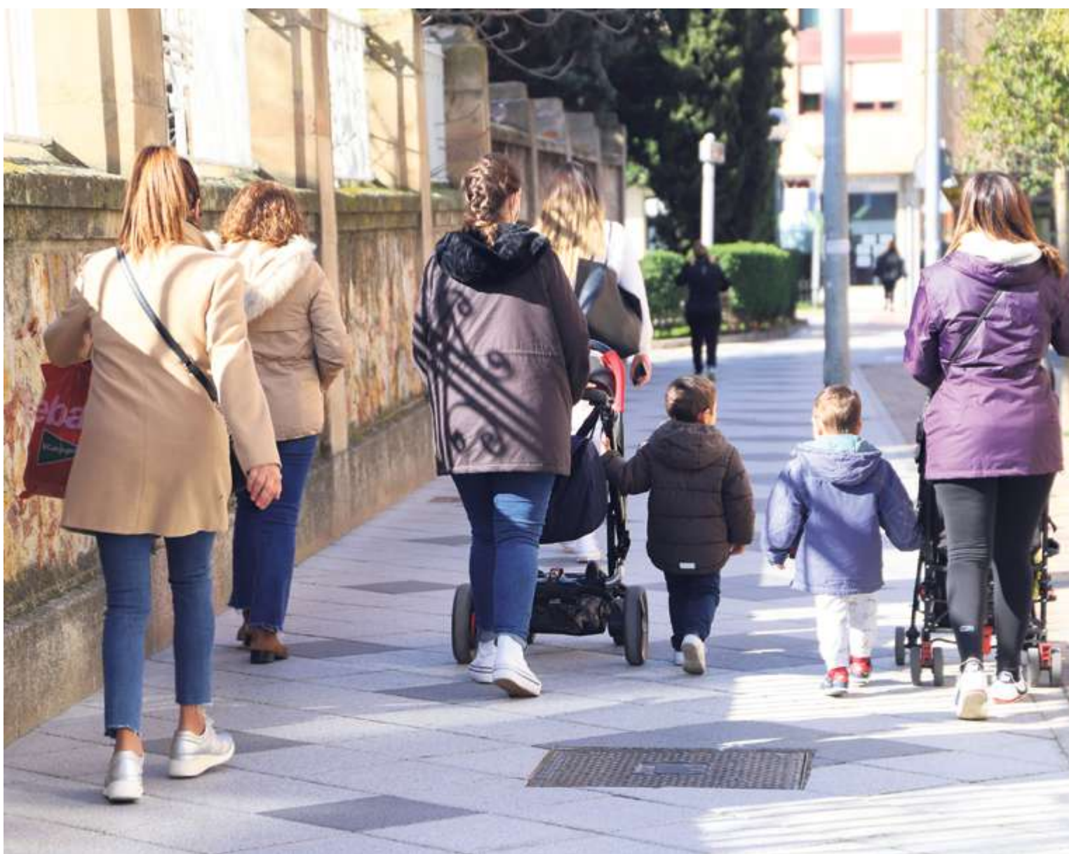
Un grupo de mujeres camina por una de las calles del centro de la ciudad