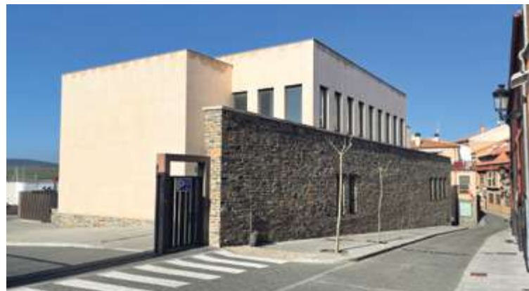
El edificio Multiusos recibe una inyección económica de 80.000 euros tras años sin inversiones

Por último, el Ayuntamiento de Alba de Tormes acometerá la renovación de conducciones en la urbanización 'Balcones de Alba'. Una