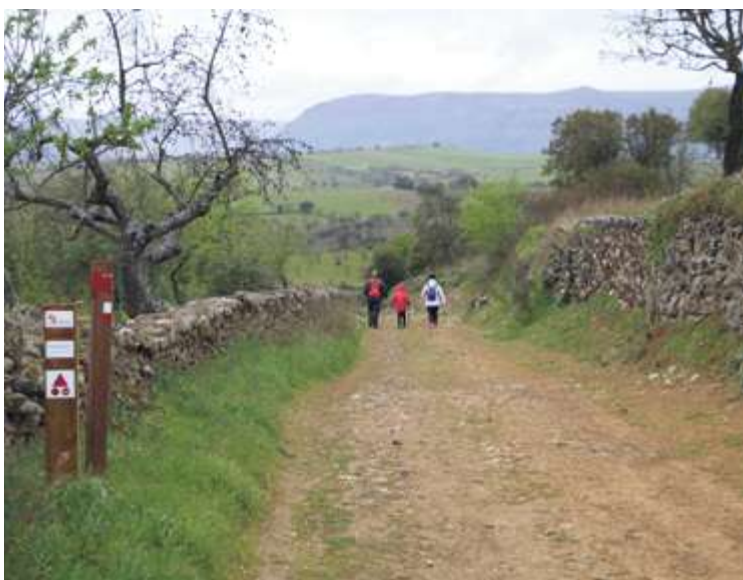
Mirador del Molinillo (arriba) y ruta del GR-14 en La Fregeneda (abajo)