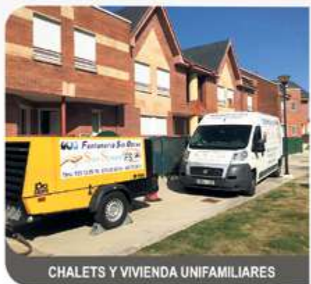
CHALETS Y VIVIENDA UNIFAMILIARES