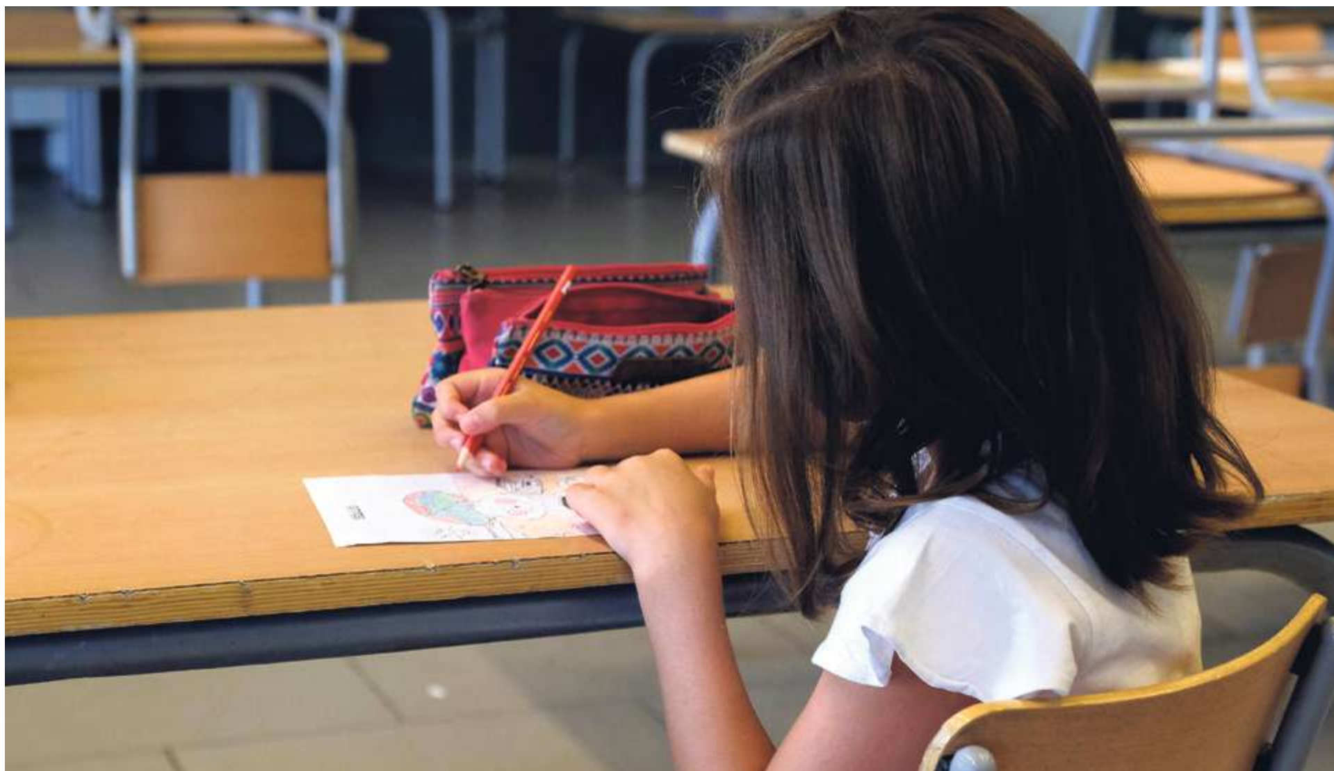
En la imagen, una alumna en un aula de un colegio realizando sus tareas escolares

Del 19 de marzo al 6 de abril, destacando como novedad la cumplimentación electrónica de la solicitud