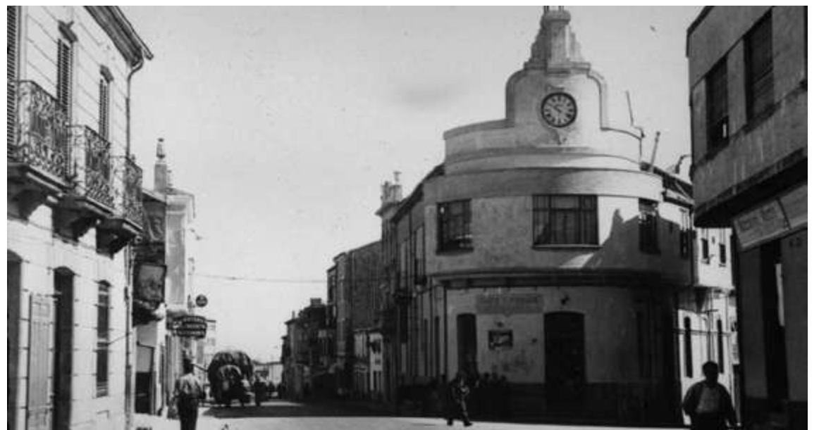
El inmueble en los años 50, cuando aún conservaba el café en su planta baja