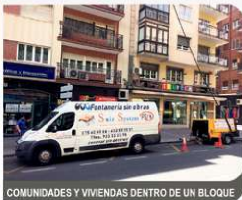
COMUNIDADES Y VIVIENDAS DENTRO DE UN BLOQUE