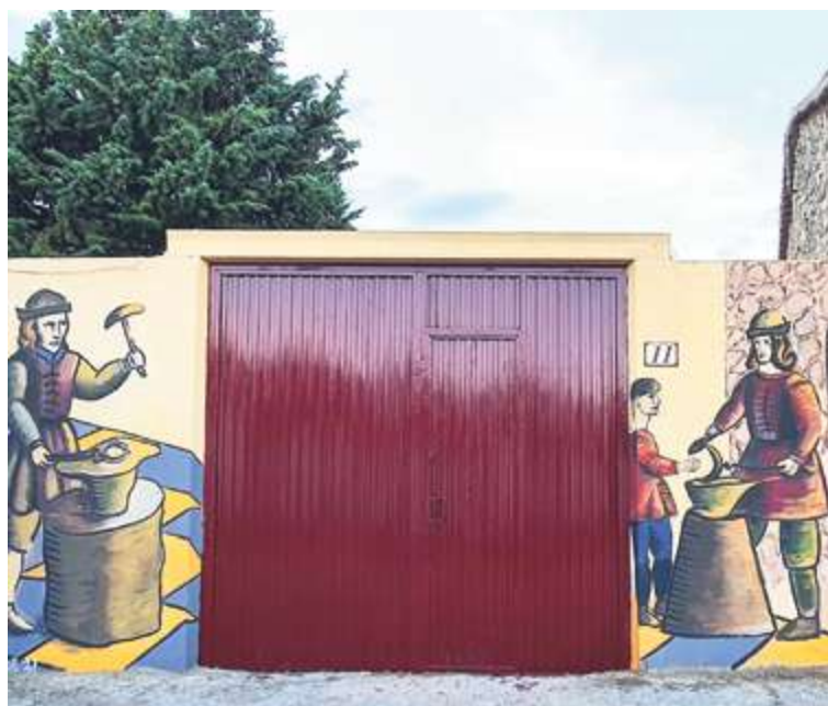
Dos de los nuevos murales del municipio

La galería al aire libre de Vega de Tirados suma cinco murales realizados por alumnos de la Facultad de Bellas Artes