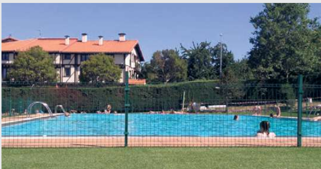
Este año se espera que abra la gran mayoría de piscinas como la de La Alberca, ya disponible

■ Durante los meses de verano el intenso calor invita a darse un buen chapuzón para refrescarse. La provincia de Salamanca carece de zonas de baño aprobadas por la Junta de Castilla y León, pero eso no significa que no existan posibilidades para nadar en una jornada de relax en plena Sierra de Francia.