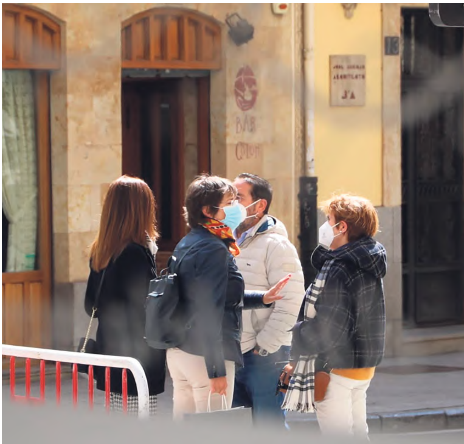
Un grupo de personas conversando en una de las céntricas calles de Salamanca