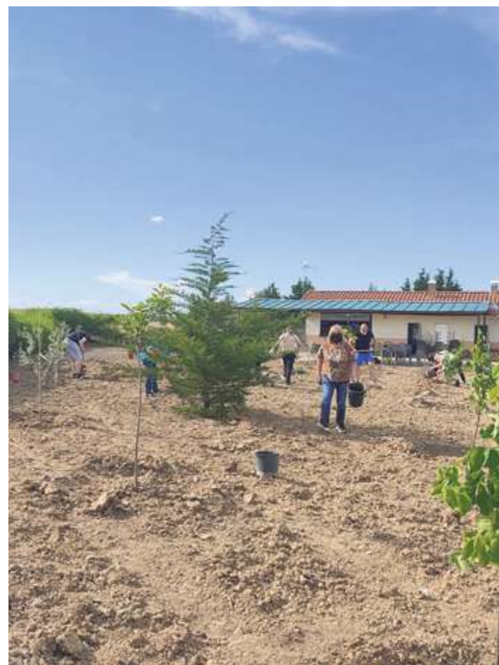
Plantación de árboles en Rollán

Rollán, Vega de Tirados y Florida de Liébana son tres de los más de medio centenar de municipios que se han sumado este año al programa ‘Arbolar’, una iniciativa medioambiental impulsada por la Diputación de Salamanca en colaboración con la Fundación Tormes-EB. Los vecinos de estos municipios ya han procedido –en diferentes jornadas– a la plantación de árboles frutales de cultivo tradicional, como higueras, nogales, moreras, almendros, manzanos, perales y membrilleros.