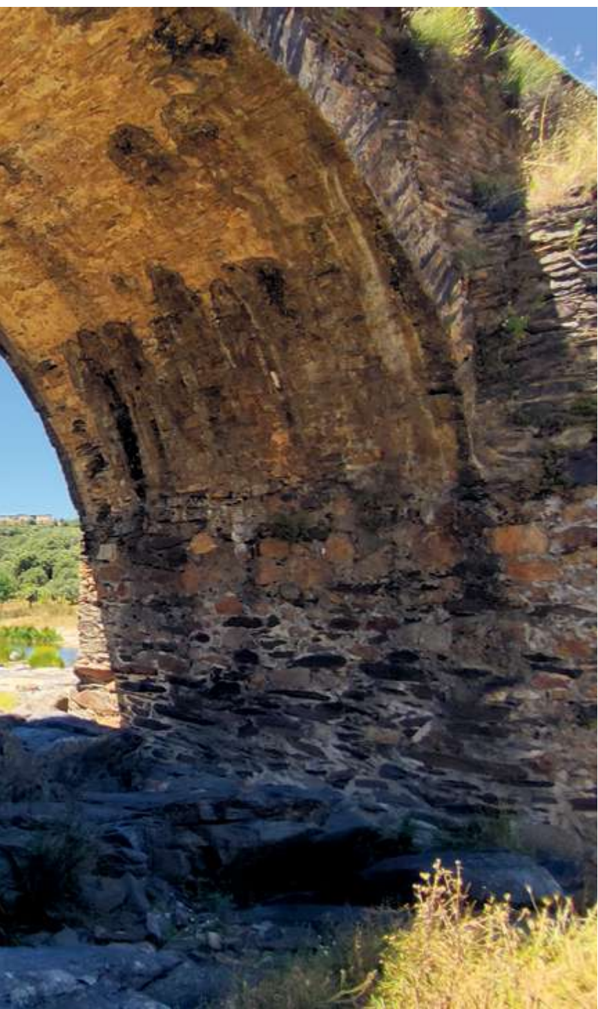
sobre el río Alagón poco antes de unirse al río Cuerpo de Hombre