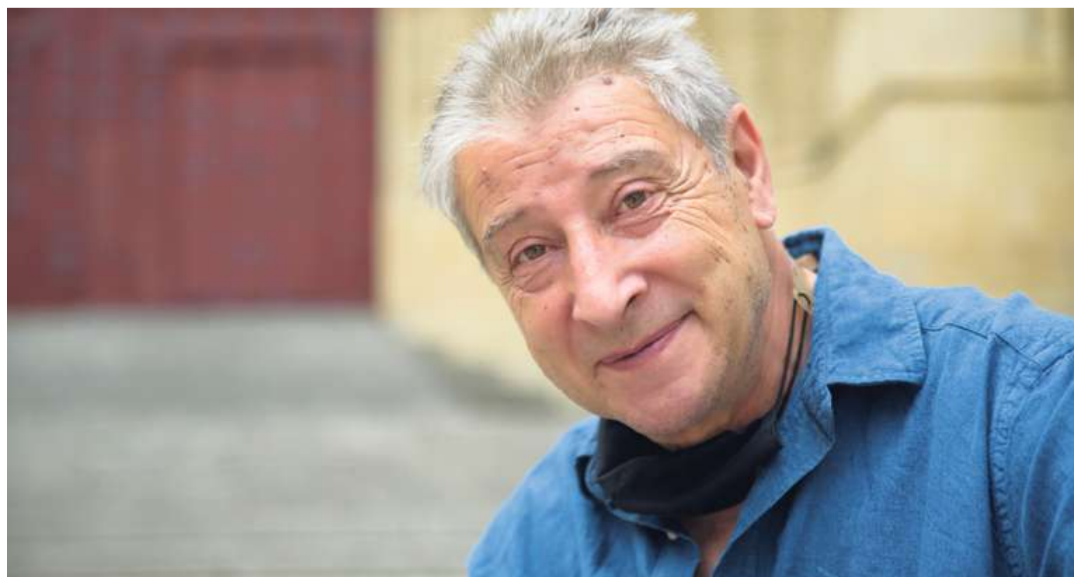
Entrevista para SALAMANCA AL DÍA al guitarrista salmantino en uno de sus rincones predilectos