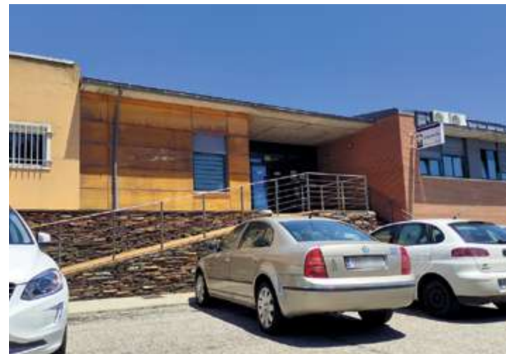
Los pacientes citados deberán entrar a través de Urgencias | ROBLES

El centro de salud de Guijuelo ha cambiado los protocolos de atención al público, ajustándose a las condiciones que va marcando la actual pandemia de coronavirus. Al ser un centro de salud de gran tamaño, se aplica la misma norma que en los grandes centros hospitalarios: no se podrá acceder a menos que se cuente con cita previa.