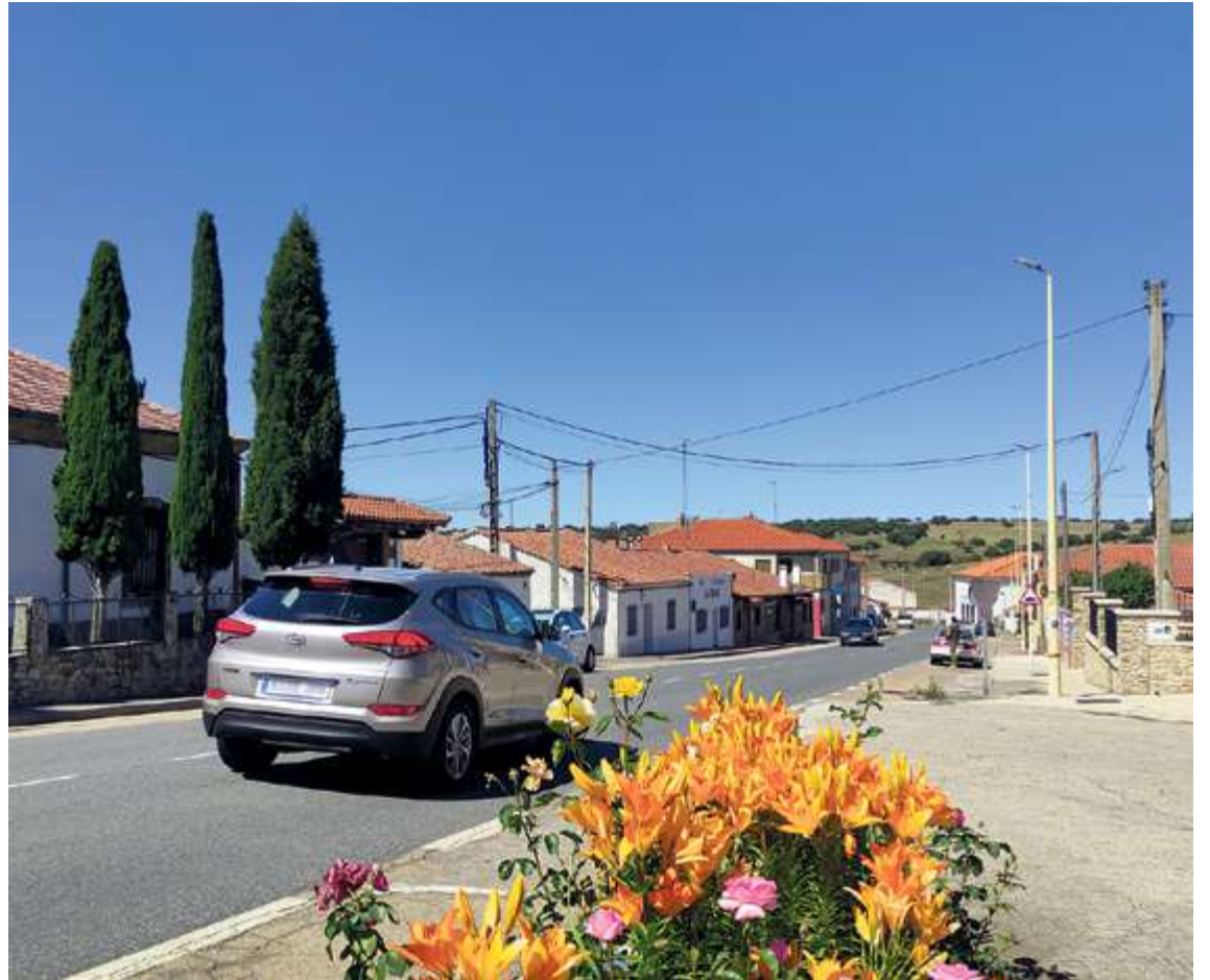
La localidad quiere explotar al máximo su condición de enclave estratégico en mitad de la provincia | KIKO ROBLES

Finalmente, también se pretende explotar la vertiente natural de la localidad, ubicada a 20 minutos de la Sierra de Francia, uno de los parques naturales destacados de la provincia, así como las excelencias de la dehesa salmantina, incluyendo el turismo taurino, pudiendo ver en su elemento a los toros bravos.