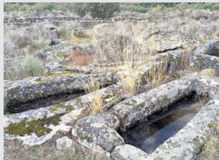
Tumbas de La Colmenera en Sobradillo | CORREDERA

En Villarino de los Aires, alrededor de la ermita en el Teso de San Cristóbal, se observan dos tumbas, una excavada en la roca y otra sobre una mole de granito. También pueden observarse este tipo de restos en, Fuenteliante, Vilvestre, Saucelle, Aldeadávila o Corporario, por citar algunos.