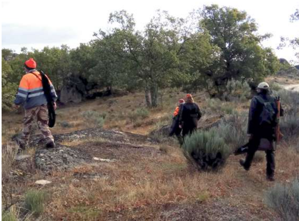
Se creará una plataforma de comunicación en la que se informará de las cacerías colectivas a celebrar | M. C.

Se regulan las especies cinegéticas, declarándose como tales las enumeradas en el anexo I de la ley. No obstante se habilitan mecanismos de rango reglamentario para declarar otras especies como cinegéticas, que se limita en el fondo y en la forma, mediante un decreto con un proceso muy garantista, o para excluir, bien temporalmente o con carácter definitivo, a determinadas especies. Se trata, por tanto, de limitar a la administración para considerar cinegética una nueva especie, pero la habilita para excluirla de forma rápida. Y se regula la posibilidad de que una especie cinegética sea declarada “de atención preferente”, por lo que será objeto de planes de gestión específicos. Aunque en un principio el lobo figura en la nueva ley como especie cinegética, este