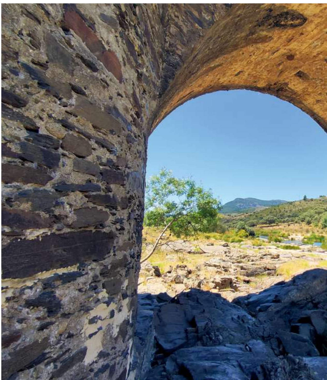
Los ríos de la Sierra de Francia atesoran una gran belleza paisajística, como esta vista del puente de piedra de Sotoserrano

Existen zonas de carácter comunitario, incluidas en la Red Natura 2000, como son las Zonas de Especial Protección de las Aves (ZEPAs) de las Sierras de Candelario, Quilamas, Batuecas-Sierra de Francia, y el río