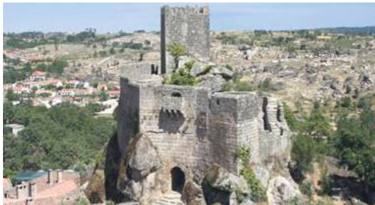
Castillo de Sortelha