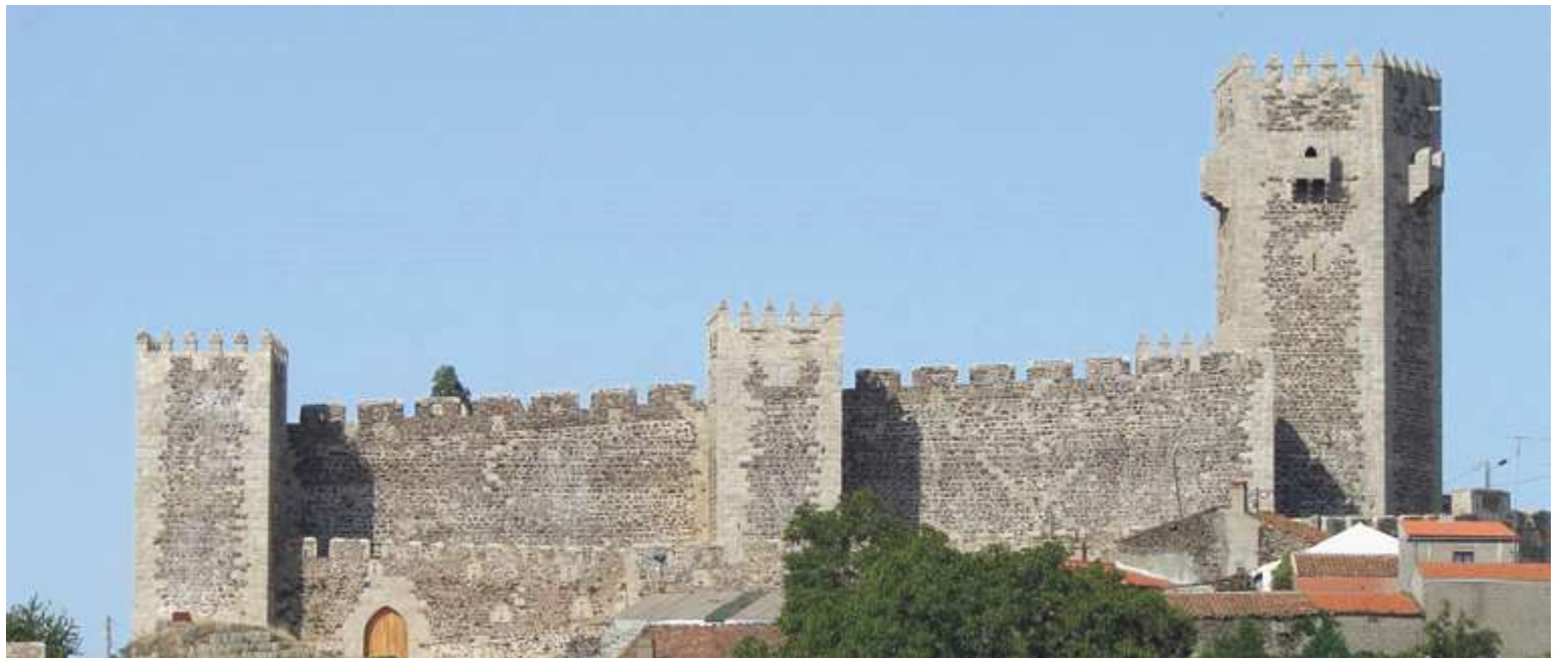
Castillo de Sabugal

El castillo de Alfaiates tenía planta cuadrada, dos torres y una barbacana reforzada por troneiras, un castillo preparado para la defensa militar moderna. La marca del poder político la hallamos en el escudo con las esferas armilares, visible en la puerta de