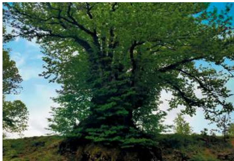
El espectacular castaño del Tío Trazas en Los Santos