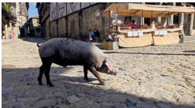
El cerdo de San Antón ya recorre las calles de La Alberca | AYTO. ALBERCA