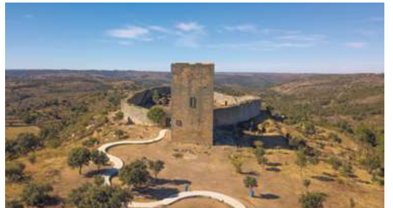
Castillo de Vilar Maior

entrada así como en el ventanal oriental de la torre del homenaje, símbolo del rey D. Manuel I, impulsor de su construcción.