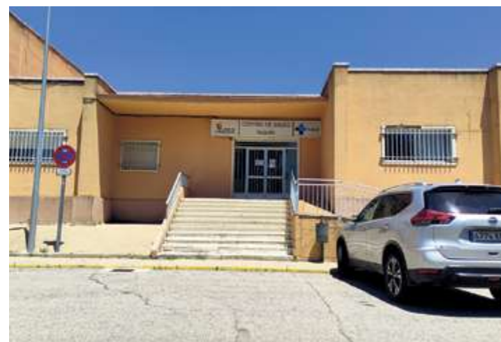
La entrada principal al centro permanece cerrada al público | ROBLES