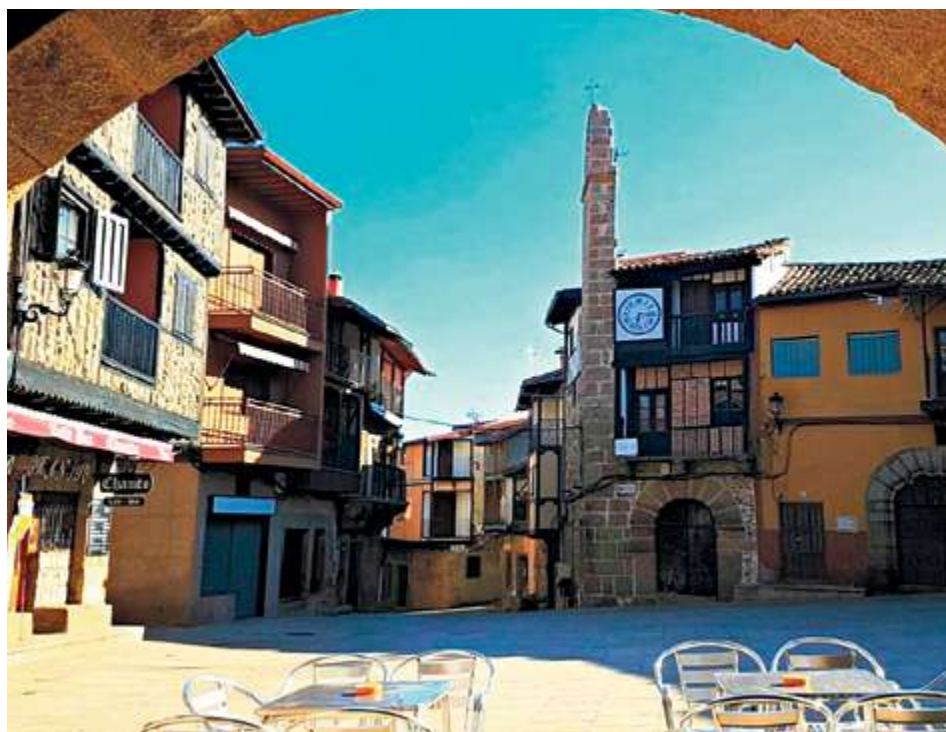
Merece la pena visitar lugares con encanto en Sotoserrano como la belleza paisajística en la isla de Romerosa (izqda.) y la tradicional torre del reloj en la Plaza Mayor (dcha.)

E quilibrio. Esa es la mejor manera de describir el carácter de Sotoserrano de cara a los visitantes. Esta tradicional localidad serrana reúne un poco de todo lo que puede resultar de interés para aquellos que decidan acercarse a conocer la Sierra de Francia.