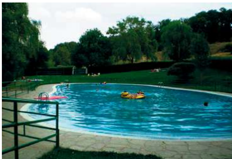
La piscina de Los Santos ha sido de las primeras en abrir sus puertas

Finalmente, se recomienda que las instalaciones tengan posibilidad de habilitar entradas y salidas diferentes. Se debe implantar un sistema de desinfección de manos y calzado en la entrada, además de poder exigirse calzado exclusivo dentro del recinto. Los usuarios deberán mantener sus pertenencias cerca el mayor tiempo posible para evitar contactos indeseados.