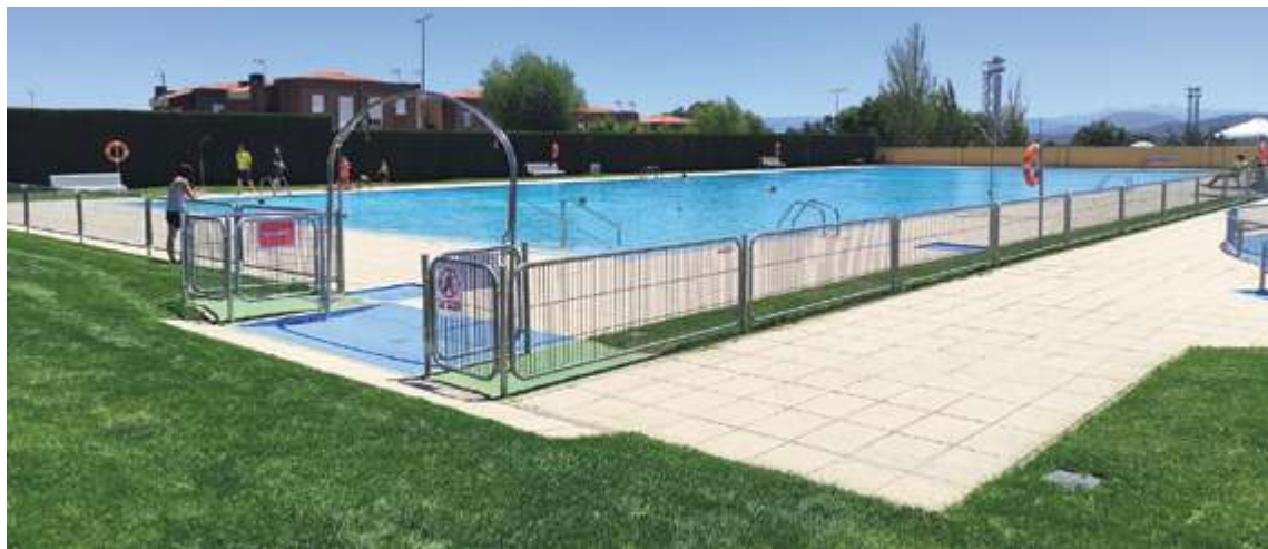
Las instalaciones en Guijuelo han sufrido mejoras en los accesos, sin cambios en los vasos

Las piscinas municipales de Guijuelo, Endrinal y Los Santos abrieron a finales de junio. Ledrada, Santibáñez de Béjar y Sorihuela abren a primeros de julio