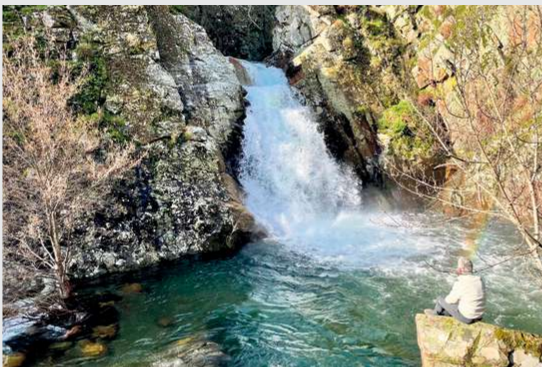
Merece la pena visitar algunas zonas como la cascada del Gancho Bermejo en Valero

Todas estas opciones son perfectamente válidas para un año en el que se sigue valorando escapar de las aglomeraciones y disfrutar de la paz y tranquilidad que otorga la naturaleza.