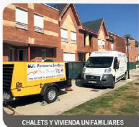
CHALETS Y VIVIENDA UNIFAMILIARES