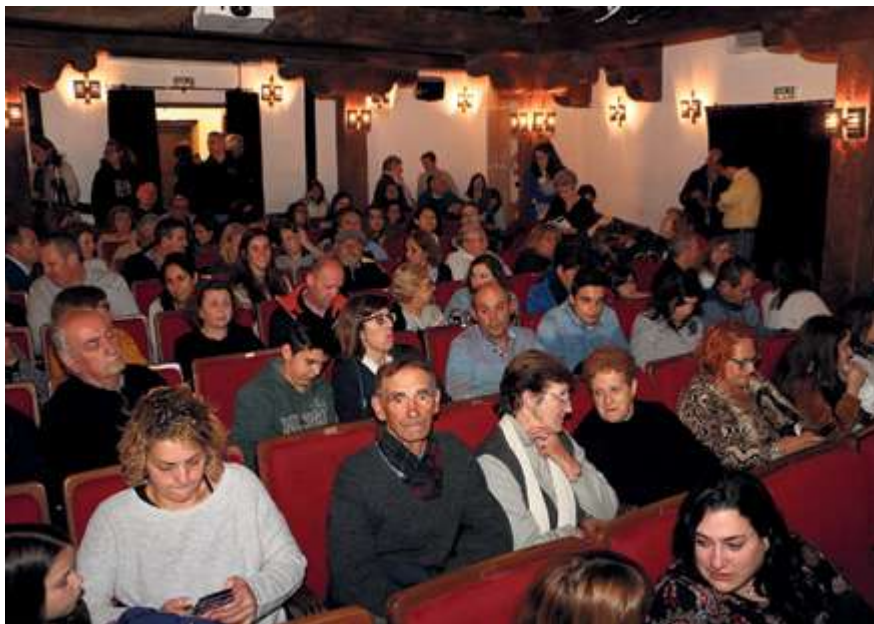
► El Teatro de La Alberca cumple su centenario repleto de actividades

Nuevo paso hacia el reconocimiento como Patrimonio Inmaterial de la Humanidad.