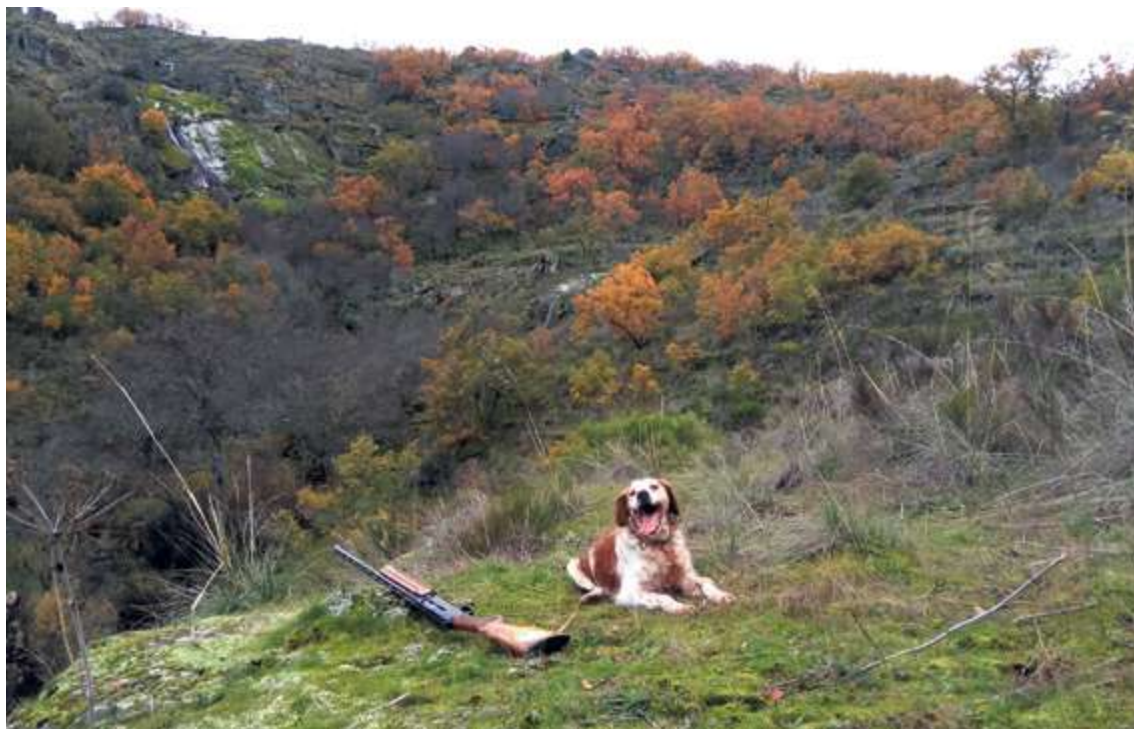
Argo en un descanso tras buscar las perdices en las Arribes | M. C.

Por esta razón no puedes desviar la atención ni un solo momento, porque habitualmente las perdices salvajes no aguantan la muestra del perro como algunos suponen,