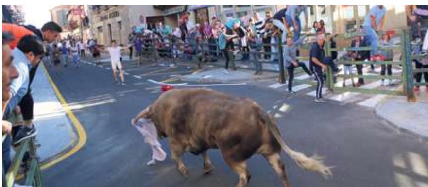
► Asociación Cultural Taurina Villa de Vitigudino. El V Toro del Cajón registró un nuevo éxito del pre-Corpus, el buen hacer de la ACTV se ha dejado notar en la celebración del Corpus.