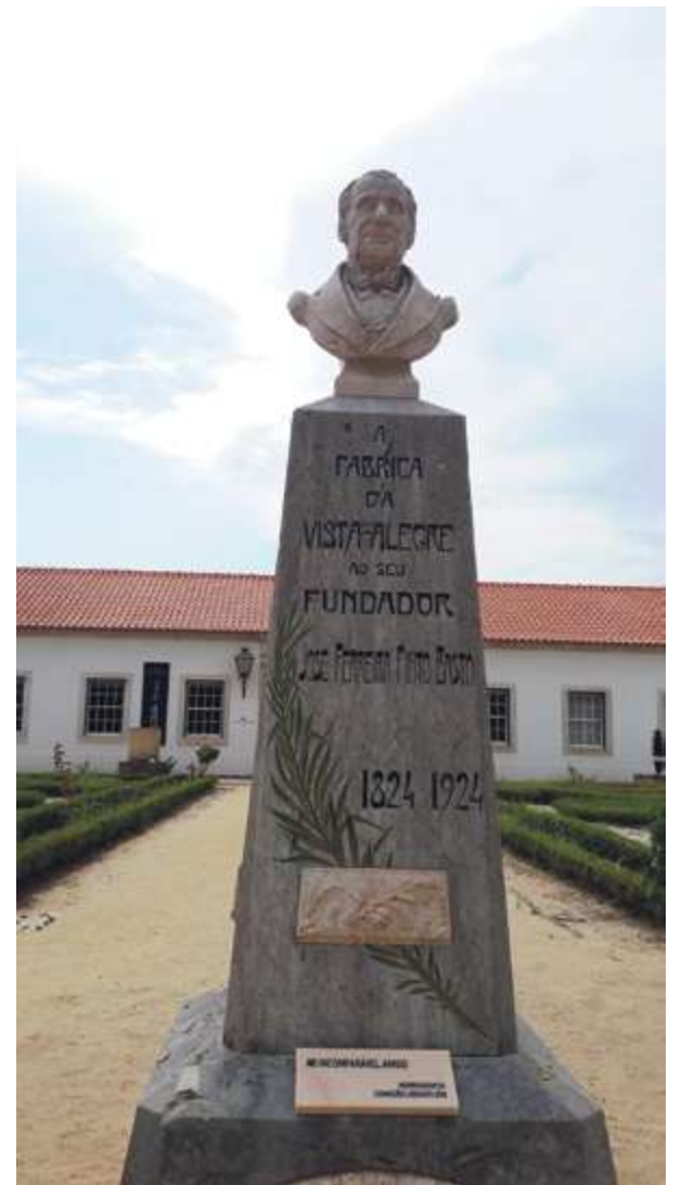
El Museo de Vista Alegre está en Ílhavo, al sur de Aveiro