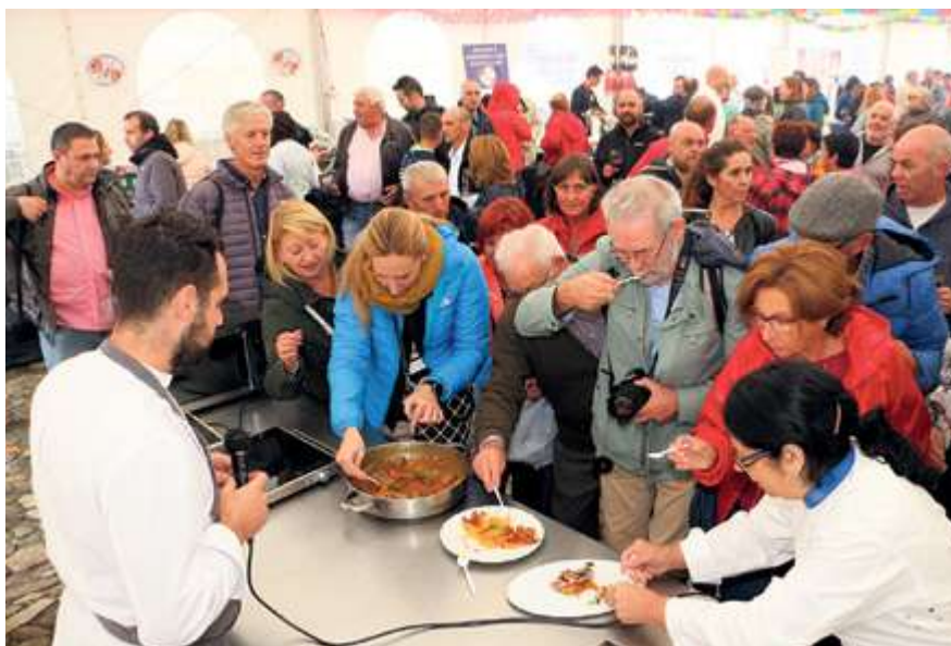
► La gastronomía dinamiza la comarca. Durante 2019 se ha vivido una propuesta gastronómica titulada 'Cocinando la Sierra de Francia' con talleres en varias localidades.

Desde un encuentro de intérpretes locales a La Pasión, que se refugió de la lluvia.