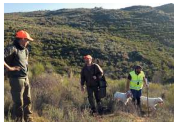
► La nueva Ley no gusta. La Consejería de Medio Ambiente ha hecho público el borrador de una Ley realizada a la medida de los antizaca y en contra del sector cinegético.