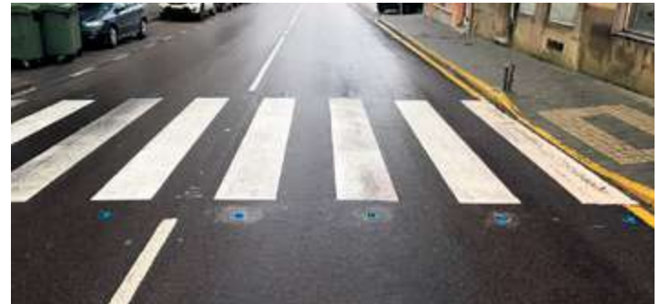
Una de las nuevas mejoras es la iluminación en los pasos de cebra

El Ayuntamiento de Guijuelo continúa con mejoras urbanísticas en la villa. Uno de los últimos trabajos que se han llevado a cabo ha sido la instalación de unas luces led de color azul de advertencia en uno de los pasos de peatones de la calle Filiberto Villalobos para mejorar su visibilidad, así como la seguridad vial.