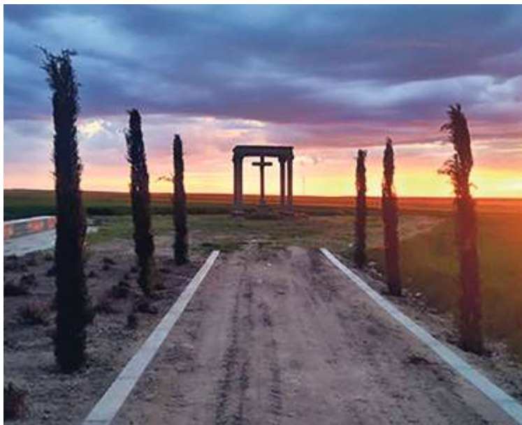
► Humilladero de Rágama