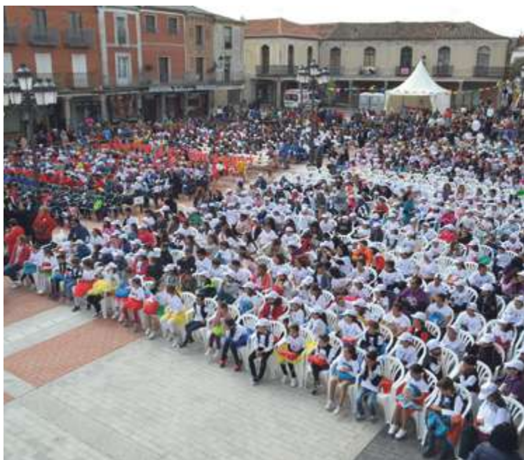
► Danzar de los Danzares

Y todo ello mientras Macotera y su nuevo gobierno comienzan a mover sus primeros hilos para tratar de hacer efectiva la sustitución de buena parte de la red de tuberías de agua, ambicioso proyecto ideado en varias fases, mientras que Villar de Gallimazo estrena circunvalación y Rágama celebraba la declaración de Bien de Interés Turístico de su Humilladero.