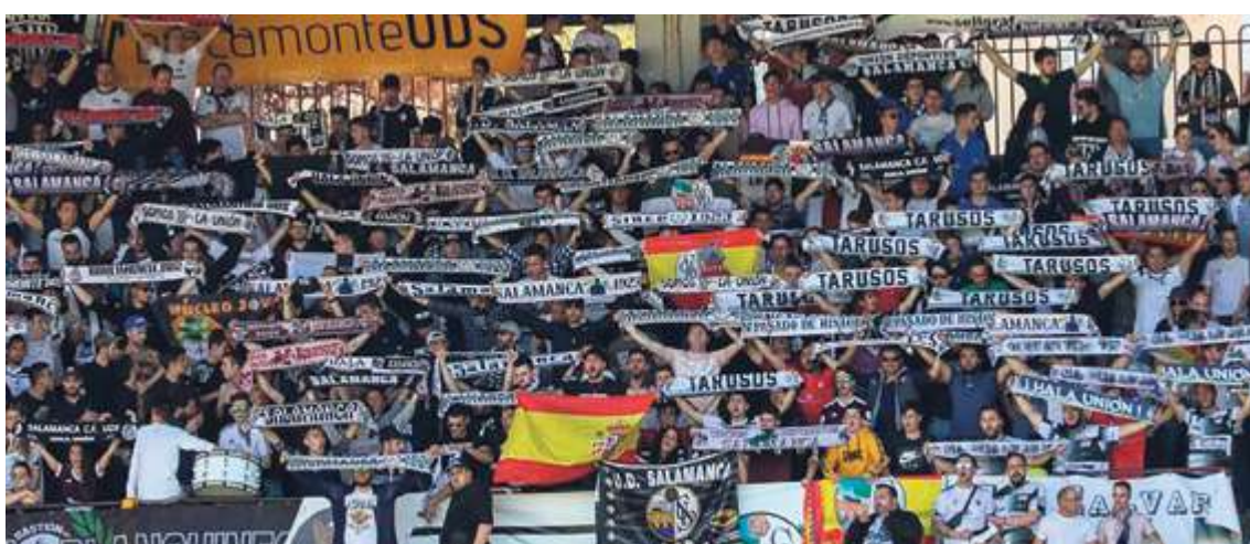
El Helmántico es el hogar de miles de salmantinos que siguen disfrutando del fútbol cada fin de semana