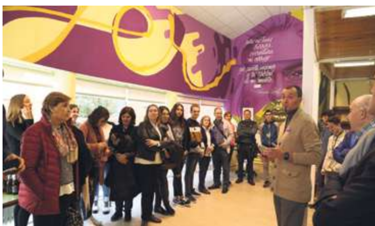
► Un mural contra la violencia de género

La localidad celebró la XXV edición del evento, que estuvo pasada por agua.