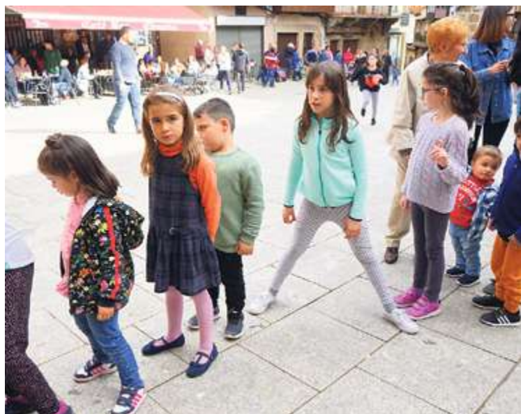
El número de niños desciende cada año y con ellos la oferta educativa

La Sierra de Francia vive tradicionalmente de la elaboración de productos, en muchos casos a nivel puramente artesanal, de la agricultura, la ganadería y naturalmente el turismo. Entidades como el Grupo de Acción Local Adriss llevan años ofreciendo cursos y talleres enfocados al fomento del empleo, formando profesionales para la hostelería, el turismo y la gastronomía, que están íntimamente relacionados. A estas propuestas se suman también las de algunas asociaciones y, sobre todo, ayuntamientos, que buscan ofrecer oportunidades a sus vecinos.