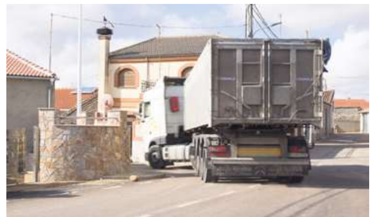
► Arabayona de Mógica reclama una circunvalación

El joven de Villoria arrasó en redes sociales desmontando la homofobia.