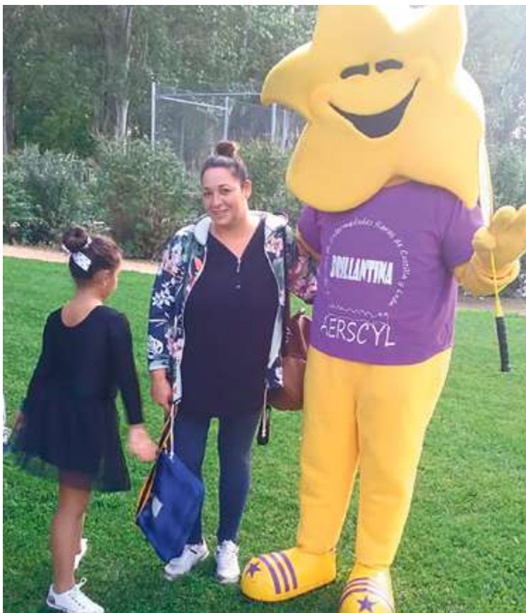
Madre e hija con la mascota de AERSCYL