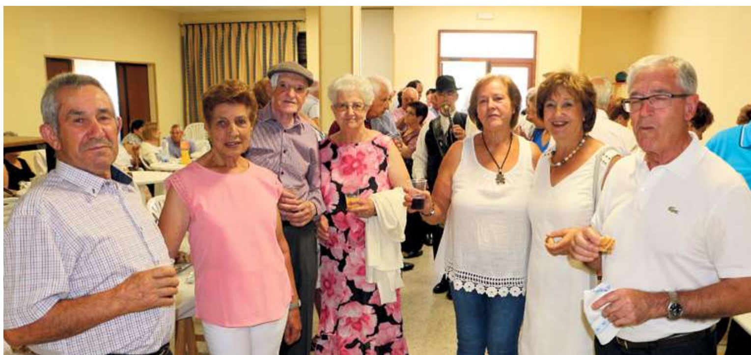
En algunas localidades el colectivo de mayores es el que dinamiza la vida local, como la Asociación de Mayores de Linares de Riofrío

La mayor parte de las poblaciones de la comarca pierden habitantes. Según datos del INE, el descenso de empadronados es la constante en casi todas las poblaciones. La mayor localidad de la Sierra de Francia es La Alberca, que posee en torno a 1.100 habitantes. Son