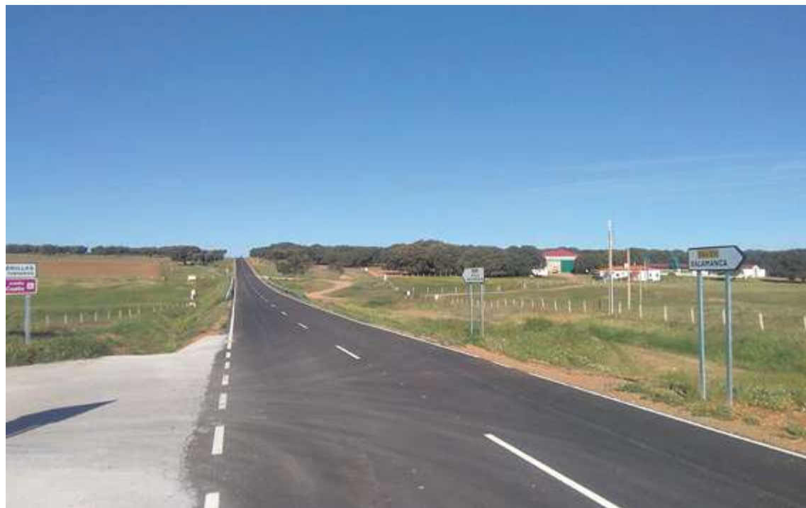
Carretera de Matilla tras las obras de mejora ejecutadas por la Diputación

Para el ensanche y refuerzo de la DSA-356 que va de Sanjuanejo