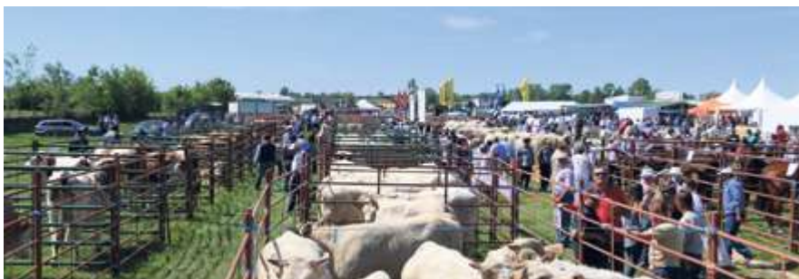
► Feria ganadera de Lumbrales. El certamen ganadero de San Isidro ha sido un referente para el sector en los últimos años, en 2019 puso nuevo récord en asistencia y público.