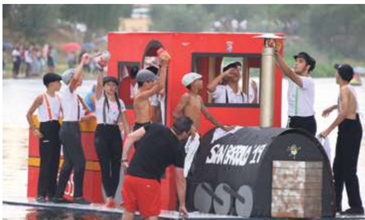
► Tormentosa bajada del Tormes sobre 'OFNIS' en Huerta

El alcalde de Aldearrubia fue elegido presidente por los representantes de los ayuntamientos.