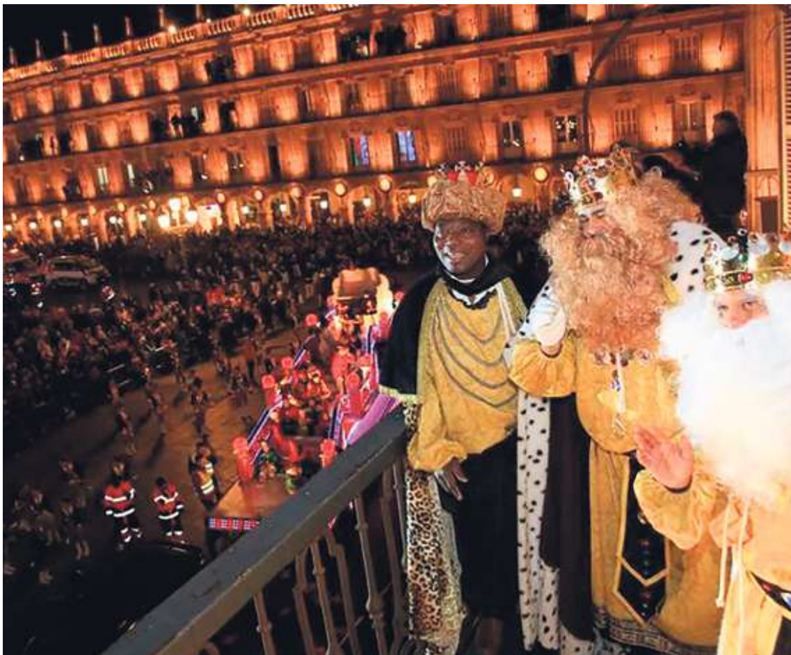
Los Reyes Magos saludarán desde el balcón del Ayuntamiento tras su llegada a la Plaza Mayor

La Cabalgata contará, además, con el apoyo de patrocinadores, entre los que se encuentran el Centro Comercial El Tormes, el