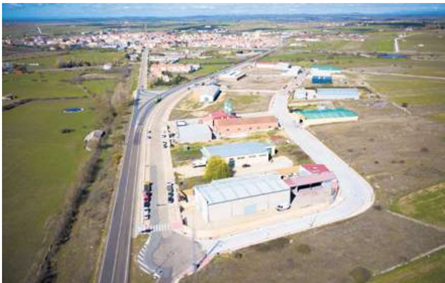
► Vitigudino de abre al desarrollo. La finalización de las obras del polígono industrial y la culminación del polígono agroalimentario dan una nueva dimensión de futuro.

Para los cazadores este ha sido un año lleno de incertidumbre después de que las Cortes de Castilla y León se vieran obligadas a modificar la Ley de Caza para hacer frente a una nueva sentencia del TSJCyL, que anulaba la Orden anual de vedas por carecer de informes que garantizaran el futuro de algunas especies cinegéticas. La batalla entre cazadores y animalistas aún no ha acabado, pues los últimos han sido capaces de que el Defensor del Pueblo y el TSJCyL hayan presentado un recurso de inconstitucionalidad contra la modificación de la ley por la que se recogían las especies consideradas cinegéticas.