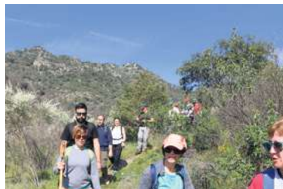
► Vilvestre se lleva la palma. Las Arribes sigue mostrando su paisaje a través del senderismo. Vilvestre, Mieza, Lumbrales, Hinojosa y Aldeadávila, las más participativas.