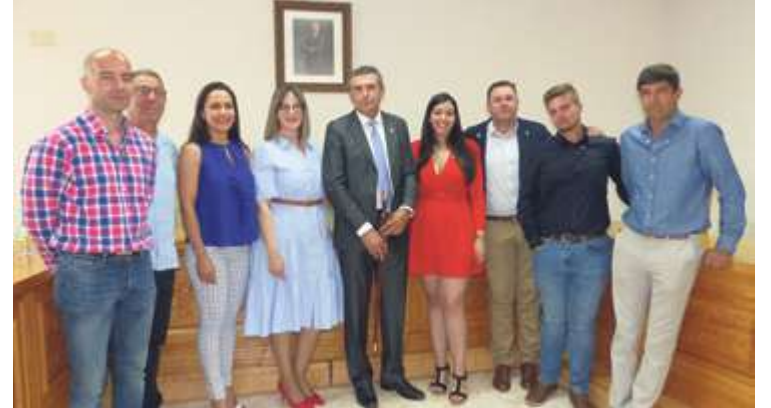
► Elegidas las nuevas corporaciones municipales

El IES Senara inauguró una inmensa pintura en favor de la igualdad.