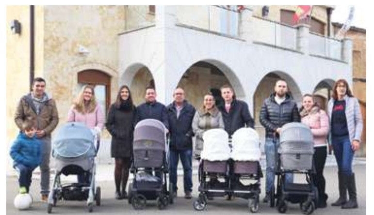
► Con mil euros bajo el brazo.

Las Cortes de Castilla y León debatieron la medida, que sacaría los camiones del casco urbano.