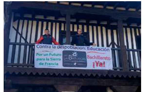
► La mayor parte de los municipios de la Sierra de Francia se decantan por la repetición de sus alcaldes

El AMPA del IESO Las Batuecas de La Alberca ha vivido un intenso año de peticiones y propuestas para conseguir que el centro se convierta en IES con la inclusión de Bachillerato y cursos de Formación Profesional.