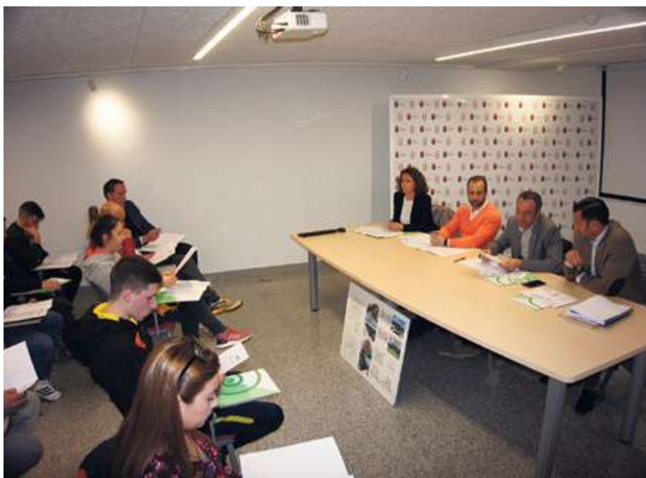
► Promoción de viviendas protegidas en Guijuelo

Las elecciones municipales dejaron 7 concejales del PP, 3 de Ciudadanos y 3 del PSOE.