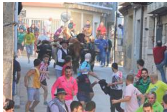
► Los encierros, el evento más seguido. Hablar de fiestas en Arribes es hablar de encierros, y entre ellos los de Aldeadávila, San Felices, Lumbrales, Villavieja y Villarino.