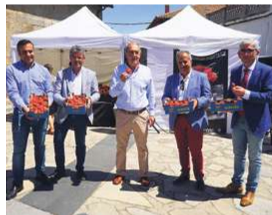
► Linares de Riofrío sigue apostando por su feria

La acción formativa de empleo de la localidad se encargó de remodelar las antiguas escuelas santeñas.