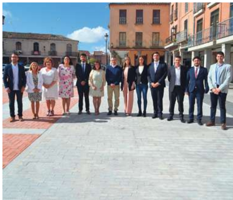
► Nueva Corporación en Peñaranda

El Danzar de los Danzares congregaba a más de mil escolares en la renovada Plaza de la Constitución.