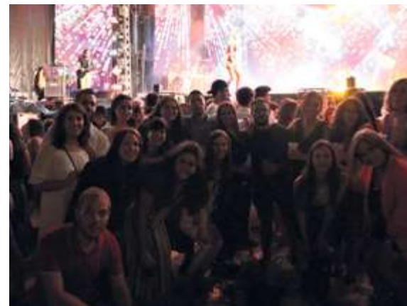
► Gran espectáculo de Função Publika en Vitigudino. La otra gran orquesta del circuito ibérico llenó la Plaza de España en las Ferias y Fiestas de la Virgen del Socorro.