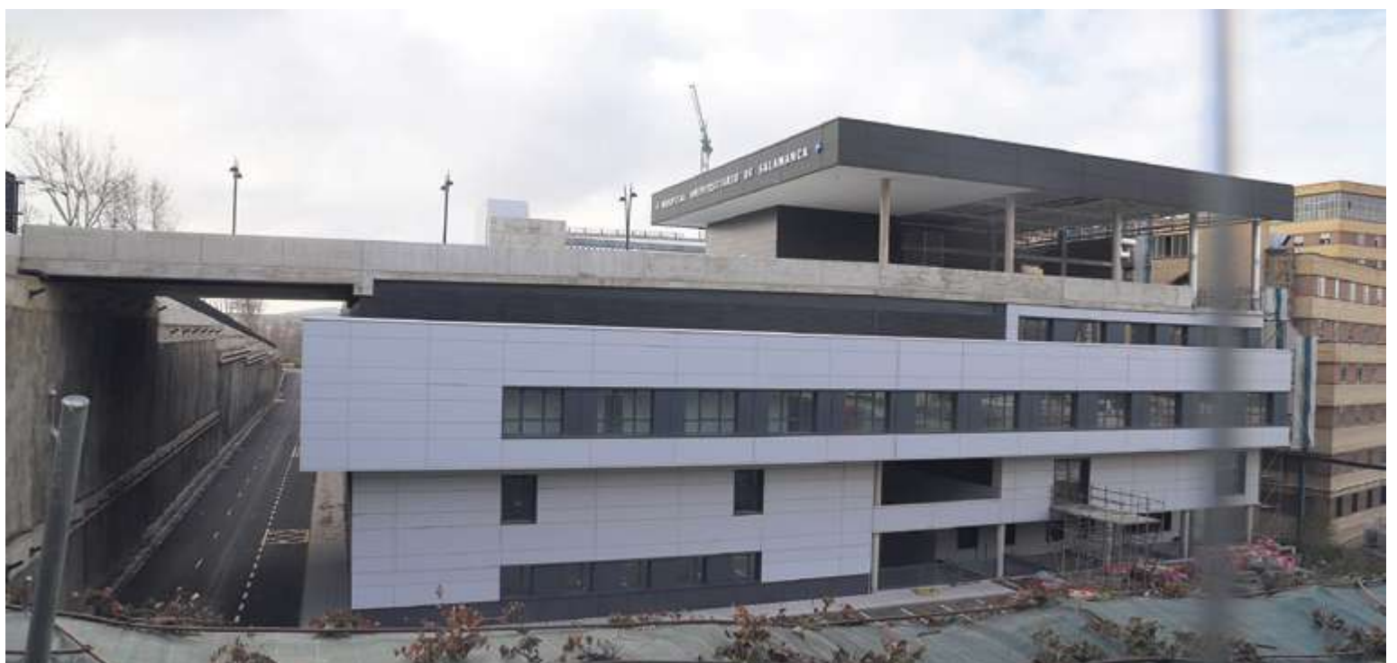
El segundo semestre de este año es la fecha prevista para la apertura del nuevo Hospital de Salamanca