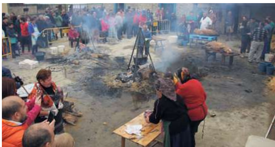
► La Zarza de Pumareda ha sido uno de los municipios. Unas incluidas en el programa de la Diputación 'Fiesta de la Matanza Tradicional', y otras no, una decena de municipios se ha sumado a esta actividad en la comarca para conservar y mostrar esta tradición.