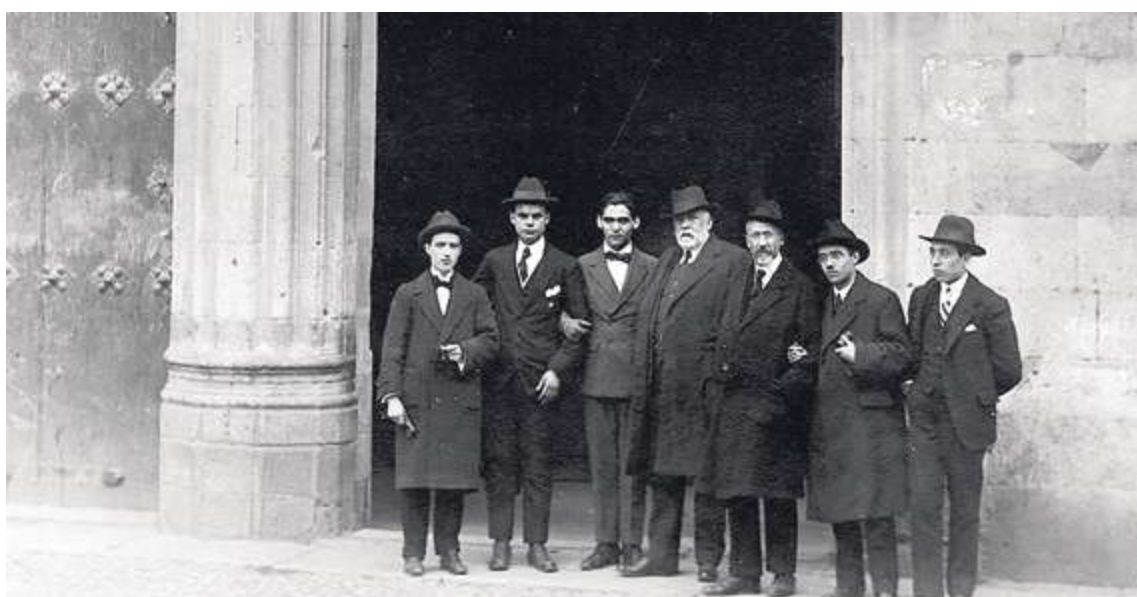
García Lorca en Salamanca

das con ciertas pronunciaciones. Lorca tenía una devoción increíble por Rosalía y el cancionero gallego, por eso me apetecía cantar en esta lengua. Es una historia tremenda, llega un señor a la casa donde hay tres hijas, y viola a una de ellas. Es una historia para enseñar a las niñas que no se dejen raptar.