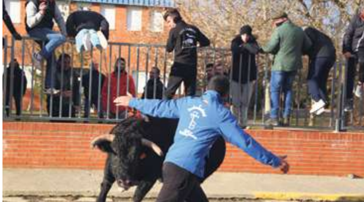
► Babilafuente celebra su primer Toro de San Blas

El 2019 ha dejado otros titulares relevantes como la petición de construir una circunvalación en Arabayona de Mógica