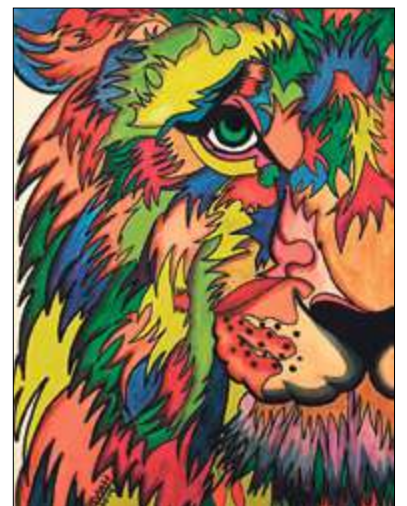
ILUSTRACIÓN: SILVIA HERRERO

Construimos grandes momentos... ...de pequeñas cosas