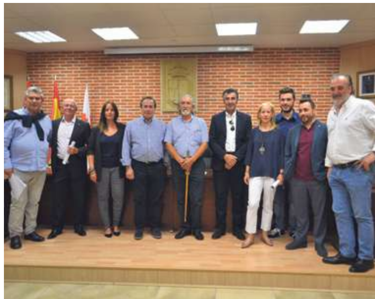
► Nuevo gobierno en Macotera

La Junta concedía al Humilladero de Rágama el título de Bien de Interés Turístico.