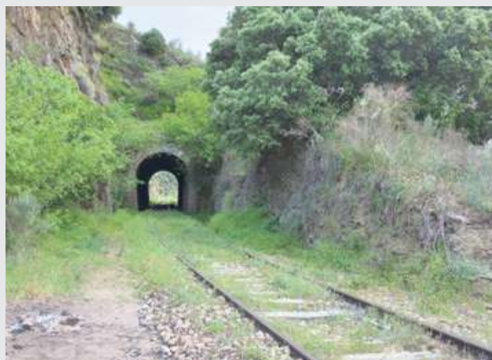
La vía fue cerrada al tráfico ferroviario el 1 de enero de 1985 | E. C.

Y mientras tanto, la infraestructura viaria se sigue deteriorando por la falta de mantenimiento, el abandono de los responsables y las inclemencias meteorológicas, como las recientes borrascas que han provocado derrumbes de grandes piedras y árboles sobre la vía.