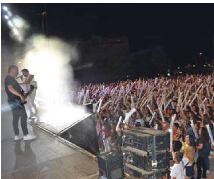
► Panorama Ilena en Ferias y Fiestas

El Ayuntamiento de Macotera estrenaba Alcaldía con el PSOE al frente.