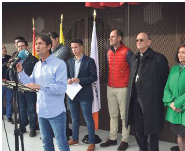
► Apertura del nuevo Centro Parroquial

La Orquesta Panorama volvía a llenar el Parque La Huerta durante las Ferias y Fiestas de Peñaranda.