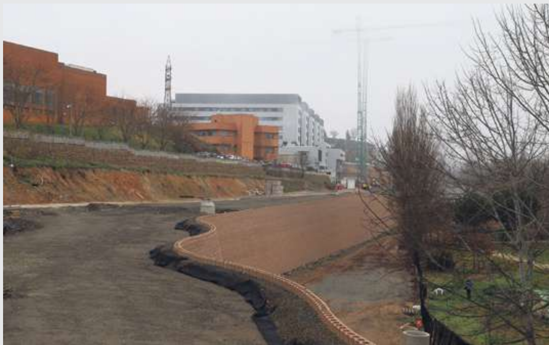
Las obras del vial avanzan a buen ritmo

▪ La construcción del vial y las plataformas de acceso al nuevo Hospital son infraestructuras imprescindibles para que el centro pueda comenzar a funcionar. Una vez solventados los problemas surgidos con la primera empresa adjudicataria, las obras del vial que conectará el paseo de San Vicente con la avenida del Doctor Ramos del Manzano comenzaron el pasado mes de marzo y "avanzan a buen ritmo", con lo que se garantiza el acceso al nuevo Hospital en el momento en el que comience a estar operativo.