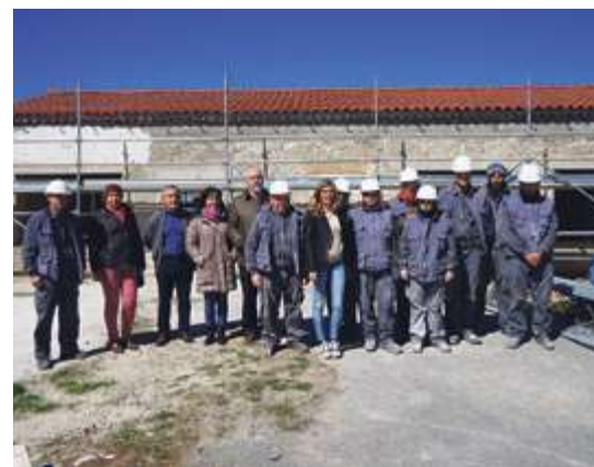
► Nuevo local municipal en Los Santos

La acción formativa de empleo de la localidad se encargó de remodelar las antiguas escuelas santeñas.