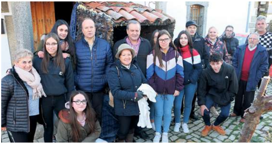
El albergue del peregrino de Fuenterrabía fue el punto inicial de la ruta belenística de Acasan

La Asociación de Amigos del Camino de Santiago celebra la XXI edición de su propuesta sobre los belenes que decidirá sus premios el próximo 12 de enero