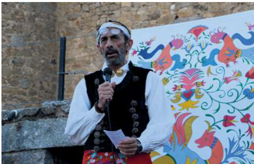
► Presentado el manual de Salvaguarda del Bordado Serrano

El agua ha sido también protagonista del año, aunque por razones totalmente opuestas. En verano se volvió a afrontar una época de dura escasez, con falta de suministro en numerosas localidades, con restricciones en muchos casos. Algunas localidades sufrieron averías, como Miranda del Castañar. Otras tuvieron que echar mano de la inventiva, como Mogarraz y su depósito militar provisional. Las borrascas Elsa y Fabien dejaron justo la estampa contraria en diciembre, con un gran temporal de lluvias que provocó que varios ríos de la comarca amenazaran con salir de su cauce.