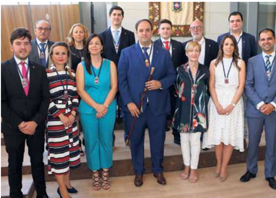
► Nueva composición del Ayuntamiento de Guijuelo

El año también será recordado por el cierre del tramo de la A-66 por el mal estado del firme entre Guijuelo y Sorihuela. Unas obras que se extendieron durante meses, iniciándose en junio y abriéndose de nuevo al tráfico a mediados de noviembre.