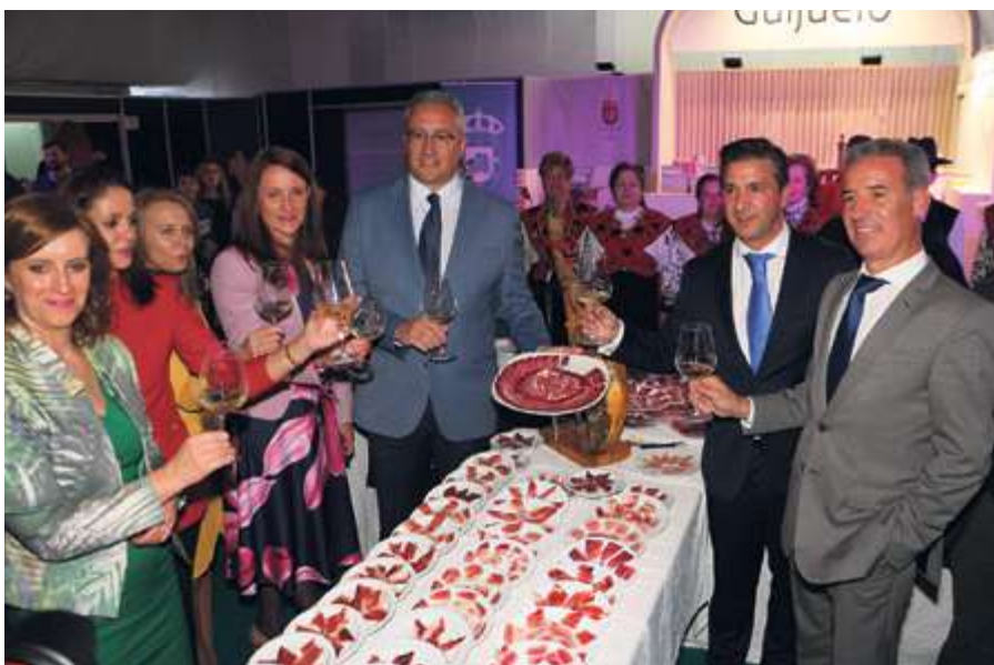
► Guijuelo y Pinhel sellan su hermanamiento

Gran número de vecinos se interesaron por la promoción de una fase inicial de 16 chalés adosados que se construirán en el entorno de la Loma del Torreón.