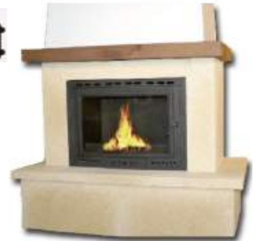
699 € MODELO LUGO REVESTIMIENTO DE PIEDRA +VIGA DE MADERA +HOGAR FUNDICION DECO 691 DE 9,9 KW Medidas: 130x97x65