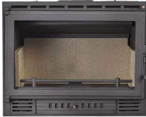
595 € MODELO R8A INSERTABLE CON TURBINAS Potencia térmica: 10 KW Medidas: 68,5x54,5x40