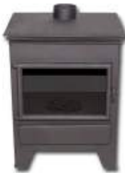
275 € ESTUFA LIBIA Potencia: 7,5 KW 55x46x70