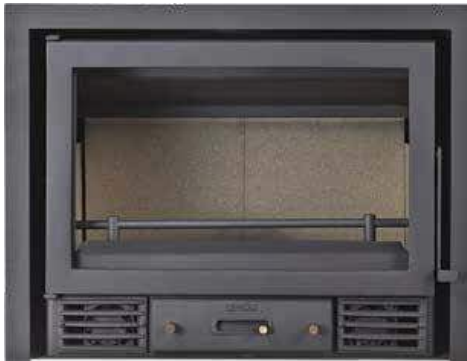
599 € MODELO LD8 INSERTABLE CON TURBINAS Potencia térmica: 10,1 KW Medidas: 75x58x40