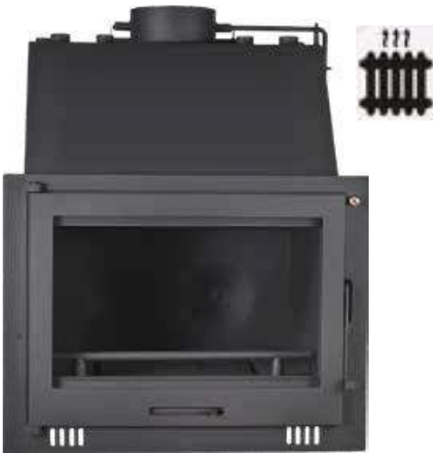
28 KW MODELOS 600/20 899 € Y 600/34 38 KW CALEFACTORA DE AGUA 1395 € Medidas 600/20: 75x57x57 Medidas 600/34: 83x68x67,5