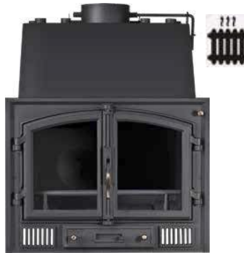
28 KW MODELOS 550/20 929 € Y 550/34 38 KW CALEFACTORA DE AGUA 1419 € Medidas 600-20: 75x57x57 Medidas 600-34: 83x69x61