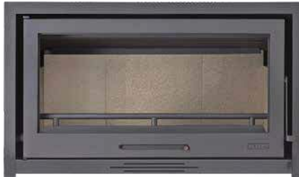
1129 € MODELO LD8H INSERTABLE CON TURBINAS Potencia térmica: 14,1 KW Medidas: 100x60x45