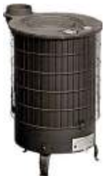
DESDE 59 € ESTUFA LEÑA ECO DESDE 12 KW