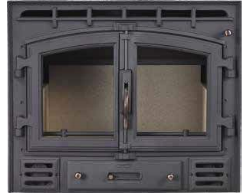
595 € MODELO R5A INSERTABLE CON TURBINAS Potencia térmica: 10 KW Medidas: 73,5x61x40