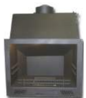
DESDE 299 € HOGARES DE CHAPA