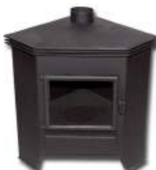
349 € ESTUFA ARGELIA Potencia: 7,5 KW 70x44,9x70