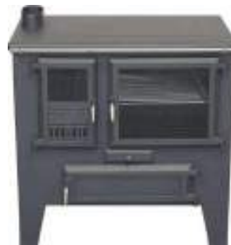
DESDE 639 € COCINAS DE LEÑA