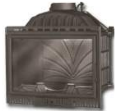
559 € MODELO DECO 701 INSERTABLE CONVECCION Potencia térmica: 103 KW Medidas: 69x53x42