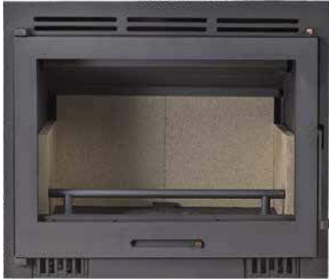
559 € MODELO LD4 INSERTABLE CON TURBINAS Potencia térmica: 10 KW Medidas: 70x60x40